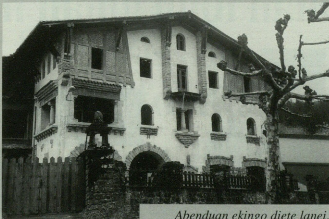
Abenduan ekingo diete lanei.

Abenduaren 15ean ekingo diote Olaran-go etxea berrizteari. Arrasateko Langile Eskolako 52 lagun arituko dira horretan. Deba Garaiko Mankomunitateak egin du Olaran berrizteko proiektua eta helburua "enpresa txikiak sortzeko zentruak egitea da". Lanekin hasi aurretik sei hilabeteko ikastaroa egingo dute.