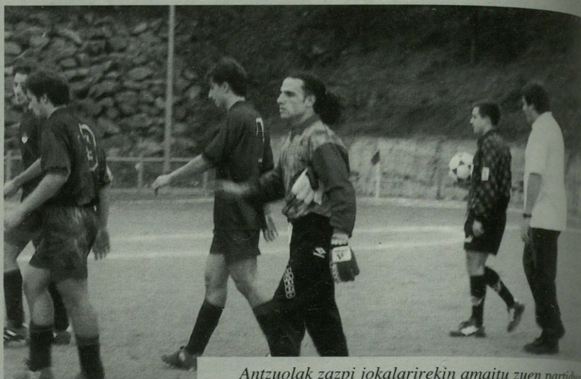
Antzuolak zazpi jokalarirekin amaitu zuen partidu...

Idolaz euskara taldeak, bilera berezia antolatu du azaroaren 20rako. Orain arteko jarduna eta aurrera begira egin beharrezkoak jardungo dute udal liburutegian. Ordubeteko batzarra izango dela adierazi digute Idolazekoek. Goizeko 11:00etatik 12:00etara. Antzuolar guztiak gonbidatzen dituzte.