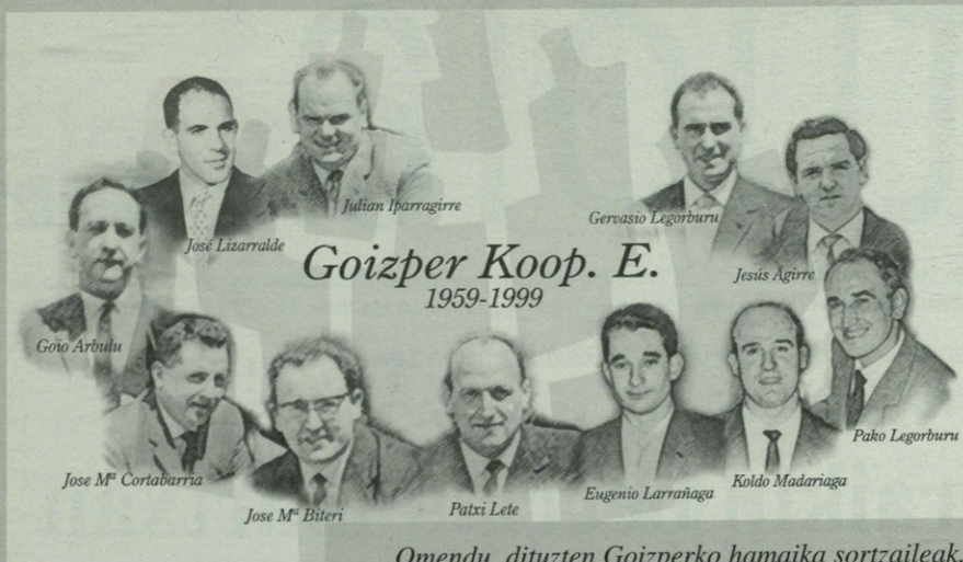
Omendu dituzten Goizperko hamaika sortzaileak.

egin behar izaten dira etengabe. Bulego teknikoak lan asko dauka eta ezin du epe luzerako ikerketetan lan egin. Bestalde, nekazaritza arloan produktu serie handiak egiten dira. Bizkarreko 500.000 ihinztargailuak egiten dira urtero. Hori dela eta, lehiakorrek izateko, produktua hobetzen saiatu behar gara etengabe, baita kostuak murrizten ere. Beharrezkoa zen Olaker bezalako zentro bat eskaera horri aurre egiteko. Izan ere, nekazaritza arloan erabiltzen diren produktuen %80 gutxi gorabehera plastikoz egiten dira, eta orain arte produktu horiek diseinatu baino ez dira egin, oso gutxi gure nekielako plastikoaren transformazioaren gainean". Ikertzen dena irakasteko ikastaroak ere ematen dira Olakerren.