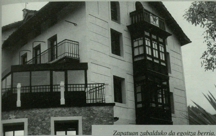
Zapatuan zabalduko da egoitza berria.