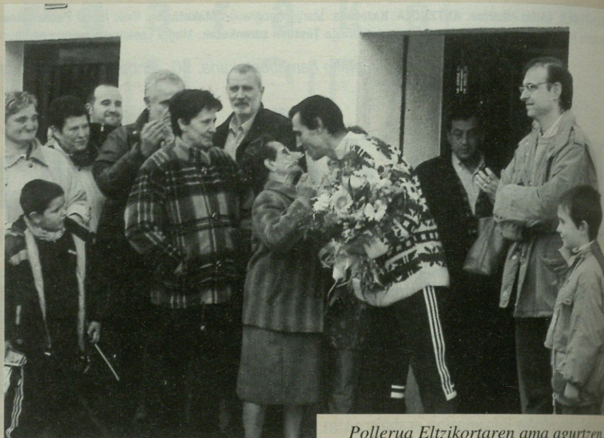
Pollerua Eltzikortaren ama agurtzen.

Lau urtian asko ezala aldatu. Hobera egin dau: baztarrak txukunaguak dare... baiña alde haundik pe ez, obra batzuk bai, baiña... Lizarraga auzuan egon nintzan eta basarriak pe oso ondo ipiñitta dare: Akiñabei, Laskurain txiki... Zatarrena frontoitzar hori: aldapia, harri sueltua, arbola bittartia... Etxe berrixekin konponduko dabe. Horretaz aparte, trafikua gehixago dago. Jentia be aldatu da, batez be zaharrak eta gaztiak. Zahar