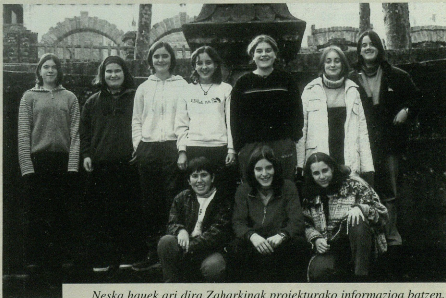
Neska hauek ari dira Zaharkinak proiekturako informazioa batzen.

Gabonetako oportetan hasi ziren baserri baserri garai bateko tresnak zenbatzen eta bakoitzaren fitxa tekniko bat osatzen. 13 eta 14 urte arteko antzuolar neska talde bat ari da lan horretan. Gero erakusketa bat egitekotan dira eurek jasotako informazioa erabiliz.