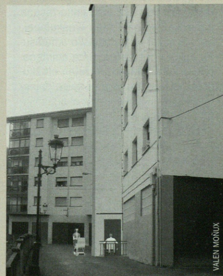
Honela geldituko litzateke Errekalden jarri nahi den igogailua.

ratzen da, baina oraindik Errekaldeko bizilagunen erabakia gelditzen da. Gainera, hau bosgarren atariaren kasuari dagokio. Orain hirugarren atarikoek eskatu dute ikerketa egitea.