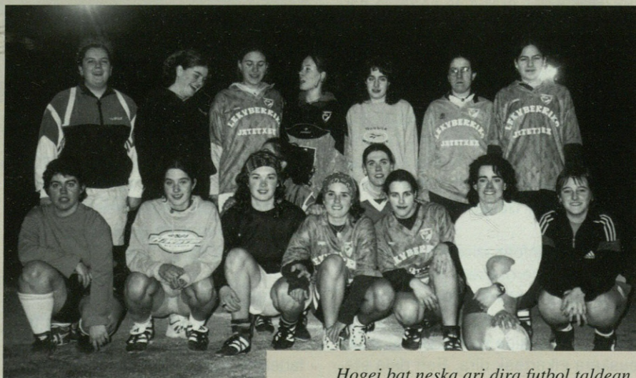
Hogei bat neska ari dira futbol taldean.

Beraz, badakizue, futbolearen egitea atsegin baduzue, aukera bikaina daukazu iluntzetan Estalan!