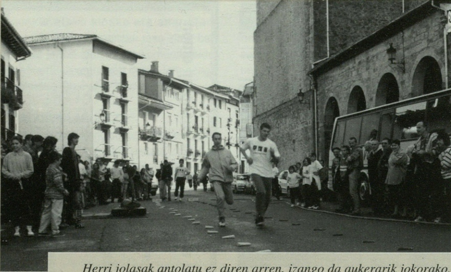
Herri jolasak antolatu ez diren arren, izango da aukerarik jokorako.