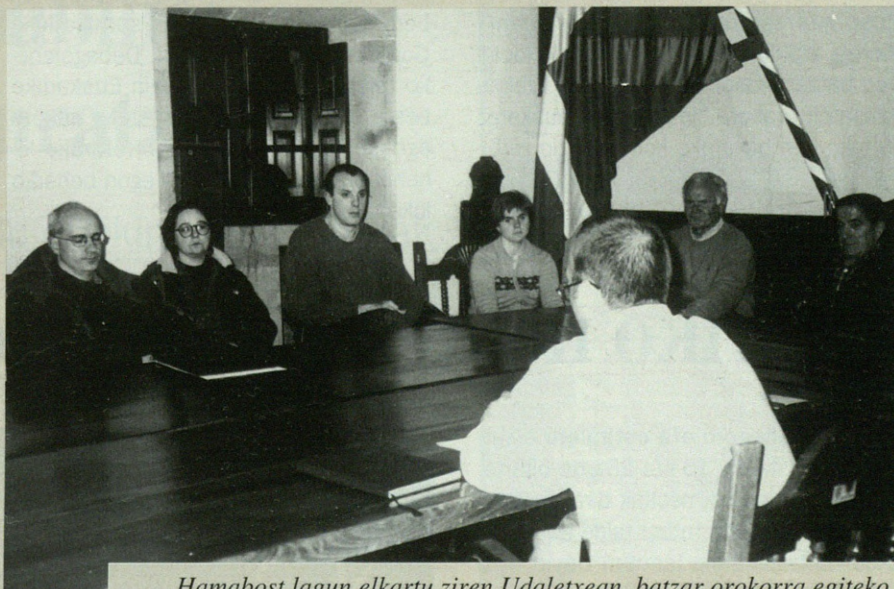
Hamabost lagun elkartu ziren Udaletxean, batzar orokorra egiteko.

Goiena informazioaren arloan, Debagoieneko herritarren eta entitateen komunikazio-beharrei ahalik eta zabalaren erantzunaren dien enpresa da. Kooperatiba da eta bazkide nagusiak bailarako euskara elkarteak dira. Hori dela eta, euskara hutsean arituko da eta Idolazek hasierako inbertsio bat egin beharko du. Izan ere, Goienak hasiera batean, bailarako telebista batekin ekingo dio lanari. Gaur egungo Arrasate Telebista eta Aretxabaleta telebistaren azpiegiturak aprobetxatuko dira horretarako. Arrasate Telebistak dagoeneko hamar urte daramatza herri telebista bezala lanean eta Aretxabaletakoak, ia hiru. Hori dela eta, emisio zentroa Arrasaten egongo den arren, bailaran beste hiru zentro egongo