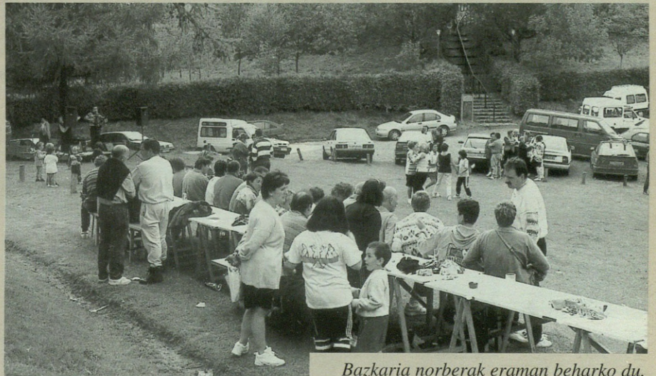
Bazkaria norberak eraman beharko du.

Trekutzeko iturria apurtuta egon da zutaillean zehar, baina dagoeneko konpondu dute Arrolakok. Eskatera egin zuten Udaletxean lehenbailehen konpon zezan norbaitek. Beraz, lasai gora joan nahi duzuenok, ez da egongo egarria asetzeko arazorik. Gogoratu Arrolakok taberna ere jarriko dutela iaz bezala, Trekutzeko txabolaren ondoan.