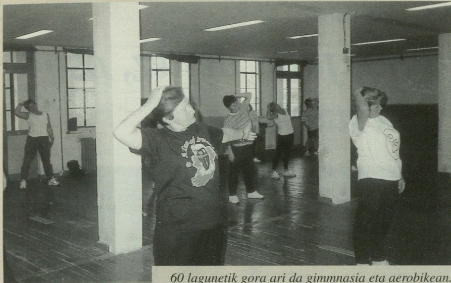
60 lagunetik gora ari da gimnasia eta aerobikean.