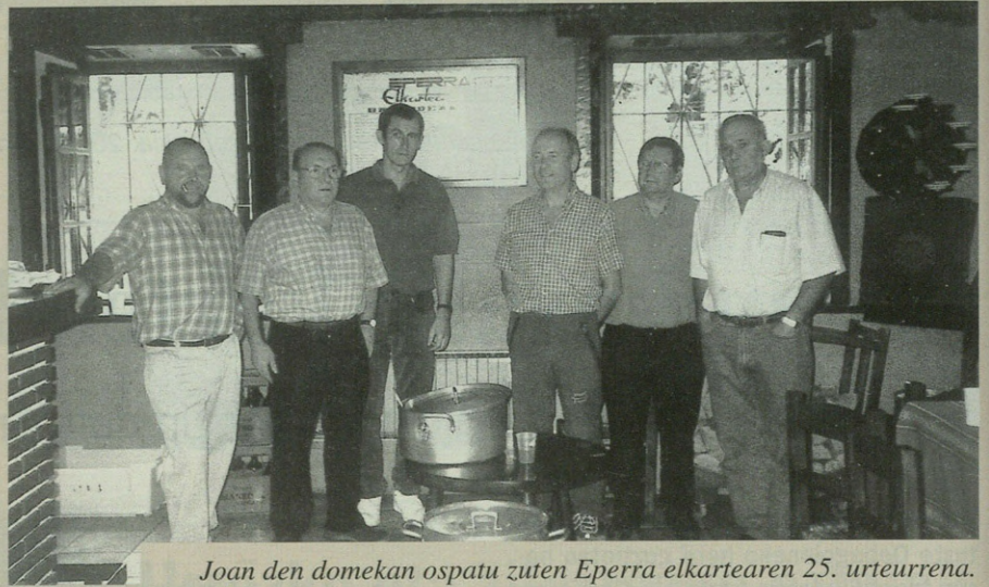
Joan den domekan ospatu zuten Eperra elkartearen 25. urteurrena.

Hirurogei sozio gara; batzuk dare jubilatuta, honezkerok hamar bat edo izango die, baiña hirurogeik kuota pagatzen dogu. Topia hirurogei ipiñi giñuan, lokal txikixa dalako; ondo lograuta dago,