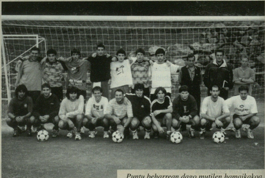
Puntu beharrean dago mutilen hamaikakoa.