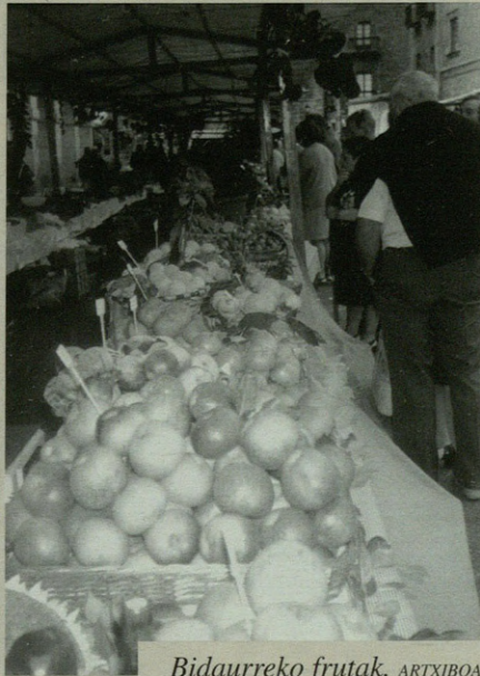
Bidaurreko frutak.