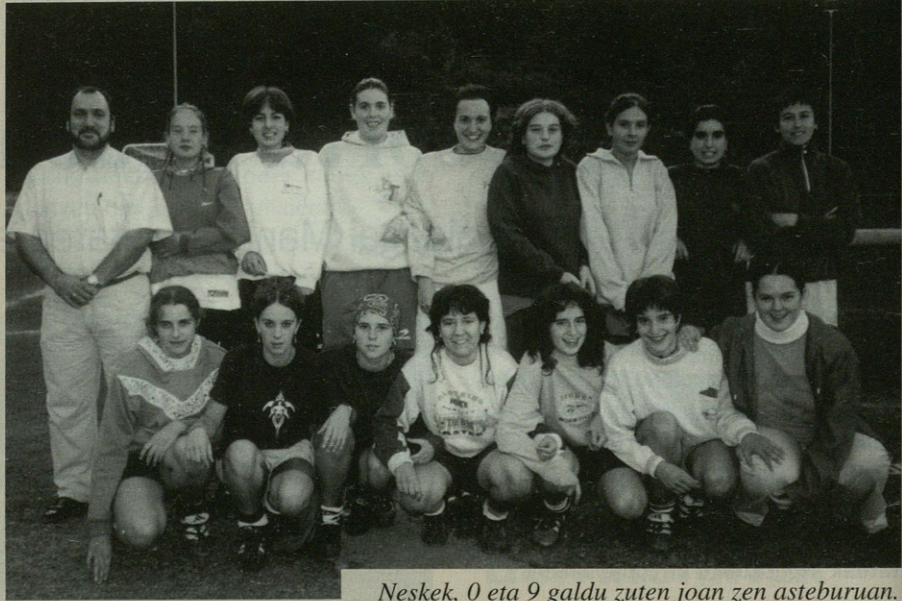
Neskek, 0 eta 9 galdu zuten joan zen asteburuan.

Denboraldiari dagokionez ez dira horren ondo hasi neskak. Lehenengo jardunaldian 7-0 galdu zuten bergararren aurka eta aurreko domekan, urria- ren 1ean ere 0-9 galdu zuten.