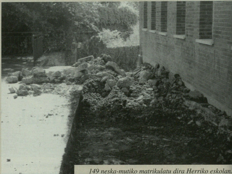
149 neska-mutiko matrikulatu dira Herriko eskolan.