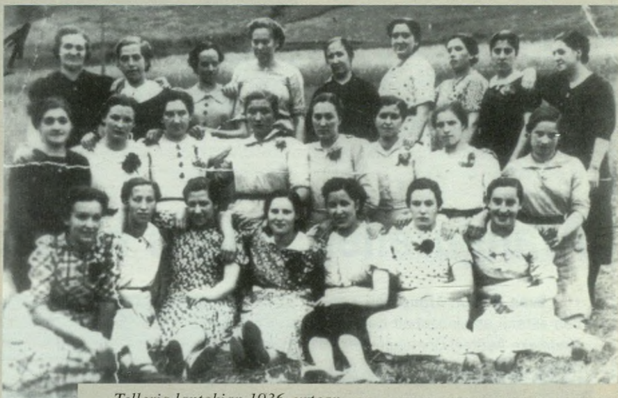
Telleria lantokian 1936. urtean. ARG.: «ANTZUOLAKO LARRU ONTZEA» LIBURUTIK

Lanak bi zutabe nagusi ditu. Alde bate-tik, etnografikoa, hau da, herriko jendea- rekin egon, euren iritzia eta bizipenak ja- so; kaleko lana, azken batean. Bigarre- nik, lehen aipatu duguna, lan historikoa, hau da, lan dokumentatua.