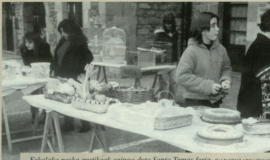
Eskolako neska-mutikoek egingo dute Santo Tomas feria.