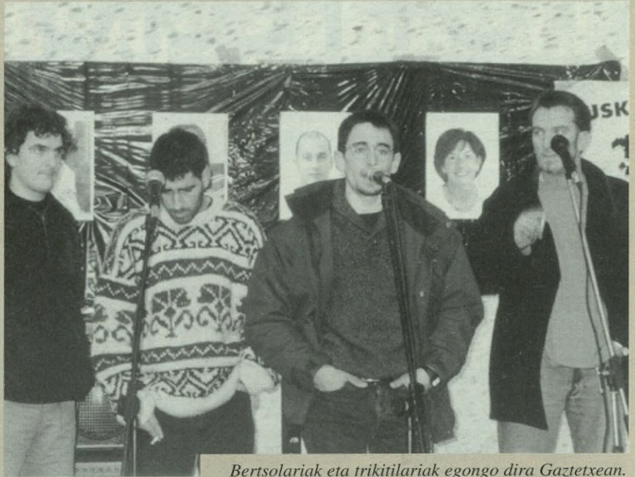
Bertsolariak eta trikitilariak egongo dira Gaztetxean.

Adierazi digutenez, mahaietara aterako da afaria, baina jasotzeko laguntza eskatzen da.