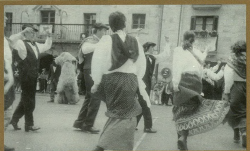
Karnabaletako ohiturari jarraitu zioten dantzariak.