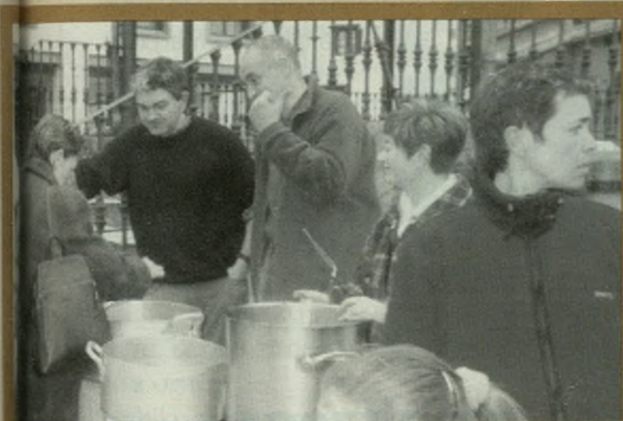
Txokolatada Pausokako gurasoek antolatu zuten.