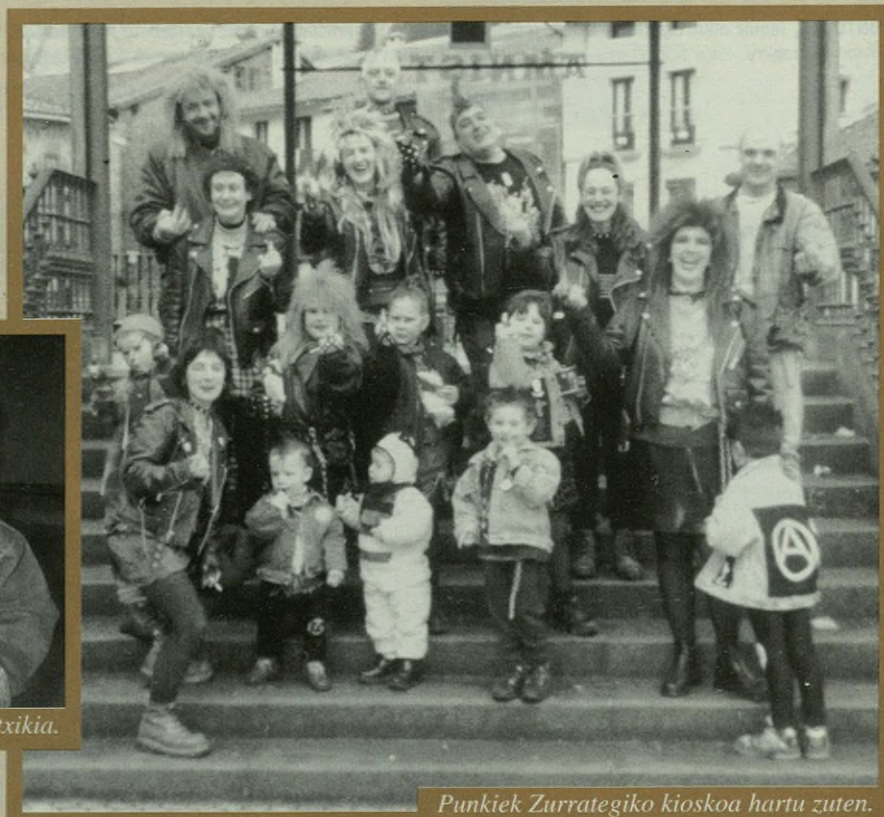
Punkiek Zurrategiko kioskoa hartu zuten.