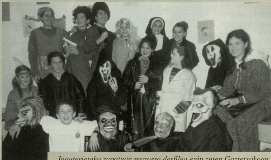
Inauterietako zapatuan mozorro desfilea egin zuten Gaztetzokoan.