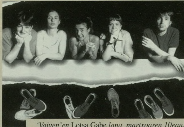
'Vaiven' en Lotsa Gabe lana martxoaren 10ean.

Galdera hauek guztiek erantzuna izango dute martxoaren 10ean, orduan etorriko da-eta 'Vaiven' antzerki taldea Antzuolara. Emanaldia zinean izango da, gaueko 10:30ean.