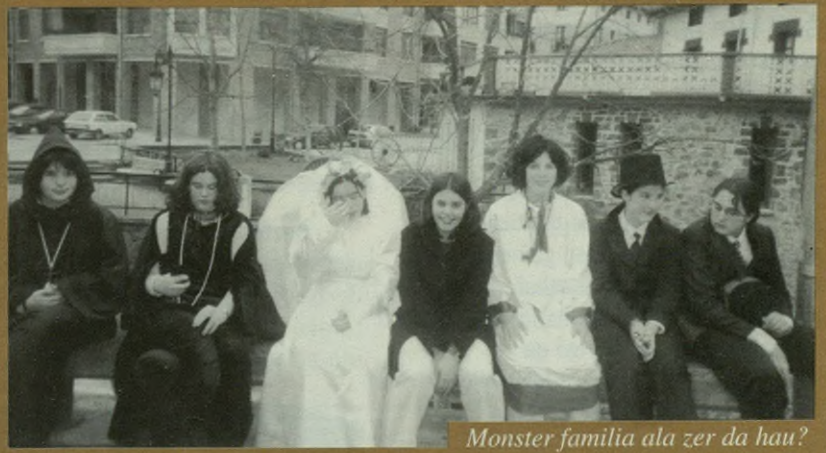
Monster familia ala zer da hau?