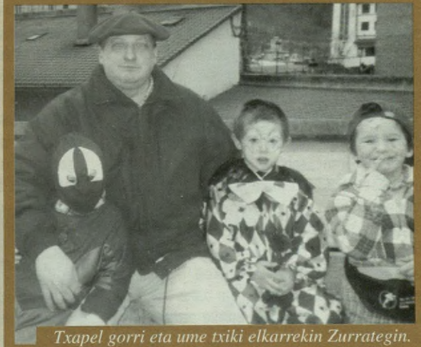
Txapel gorri eta ume txiki elkarrekin Zurrategin.