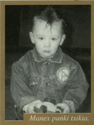
Manex punkie txikia.

E gubakoitzean eskolako umeak, zapatuan gurasoak eta neska-mutikoak eta domekan, berriz, dantzari profesional eta amateurak irten ziren kalera ez ohizko erropekin. Karnabalak ondo baino hobeto ospatu zituzten antzularrek. Egubakoitzean Pausokako gurasoek txokolatada eta torradak banatu zituzten Zurrategin. Zapatuan ijito koa-drilla ederra ibili zen kalean gora eta behera eta domekan sorgin dantza ikusteko aukera izan genuen herriko kaleetan eta gero Herriko plazan.