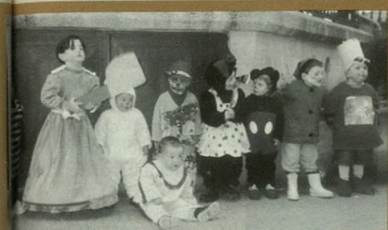
Txiki-txikitatik ohitura onak ikasten.