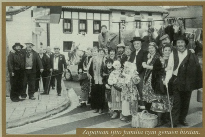
Zapatuan ijito familia izan genuen bisitan.