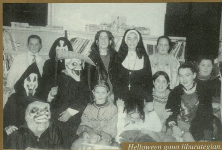
Halloween gaua liburategian.