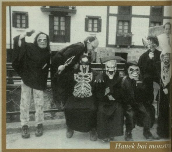
Hauak bai monstruak.