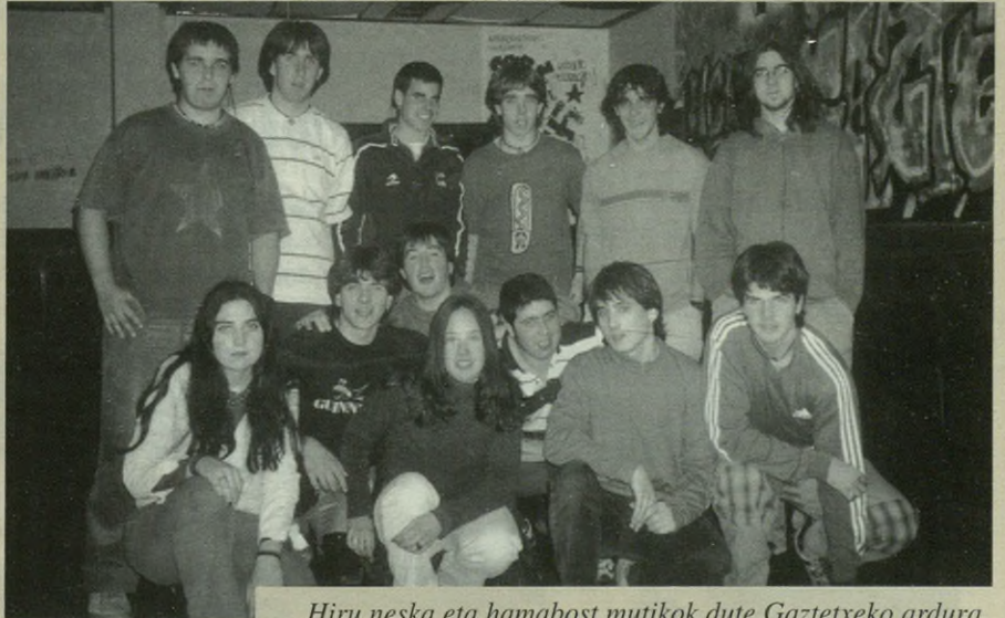
Hiru neska eta hamabost mutikok dute Gaztetxeko ardura.

Antzuolako Udalak egin nahi duen gizar-te etxea dela eta, Gaztetxearen kokapena aldatu egingo da etorkizunean. Orain