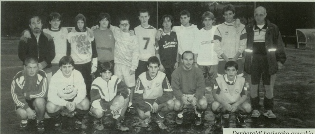
Denboraldi hasierako argazkia.

Bigarren urteko gazte mailako futbol taldea bikain ari da aspaldian. Igoera aldiko partidak jokatzeko ari da datorren denboraldian maila bat gorago aritzeko asmoz. "Eta lortuko dugu, gainera!". Ziur daude AKEko gazteak. Oraindik bost norgehiagoka gelditzen zaizkio taldeari, eta asteburu honetan etxean arituko dira mondragoetarren aurka. Zaharrenek kanpoan jokatu dutela eta, Estalan arituko dira zapatuan David Lopez de Abetxuko "Txuko"ren mutilak.