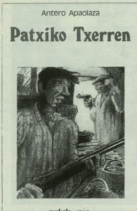
Patxiko Txerren, XVIII. mendeko nobela.