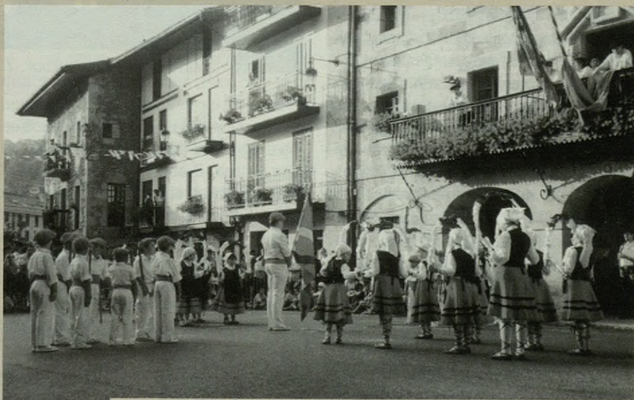
Oinarin dantza taldeko 60 bat umek parte hartuko dute domekan.

Bazkalostean, jolaserako aukera ere izango dute umeek, izan ere, arra-