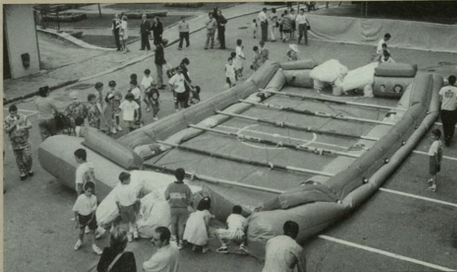
Goizez eta arratsaldez egongo da jolas parkea plazan.

KONTZERTUA Gaztetxeokoen antolatuta beheko auzoko kirol eremuan.