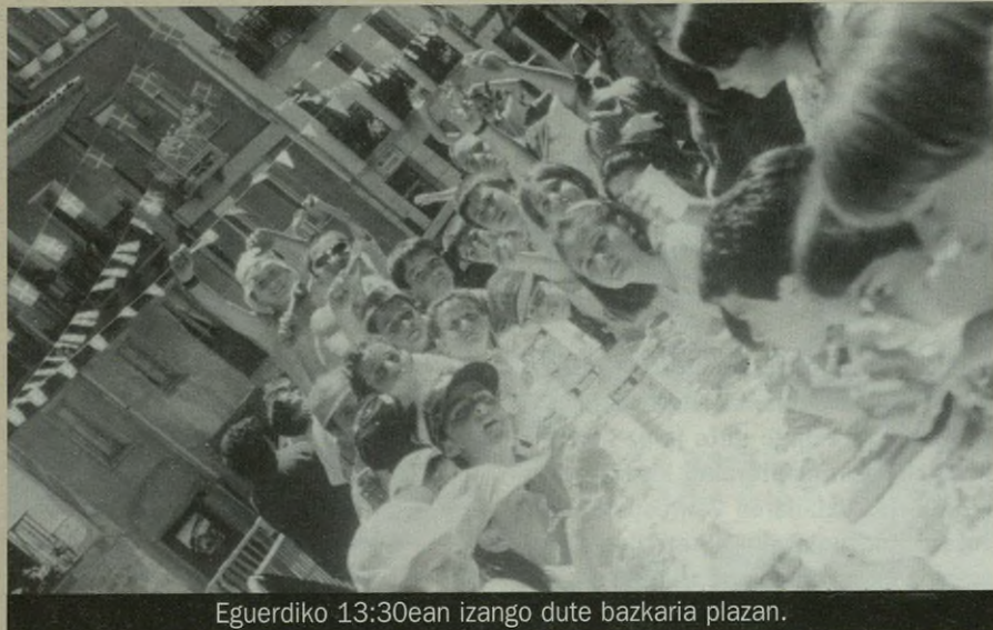
Eguerdiko 13:30ean izango dute bazkaria plazan.