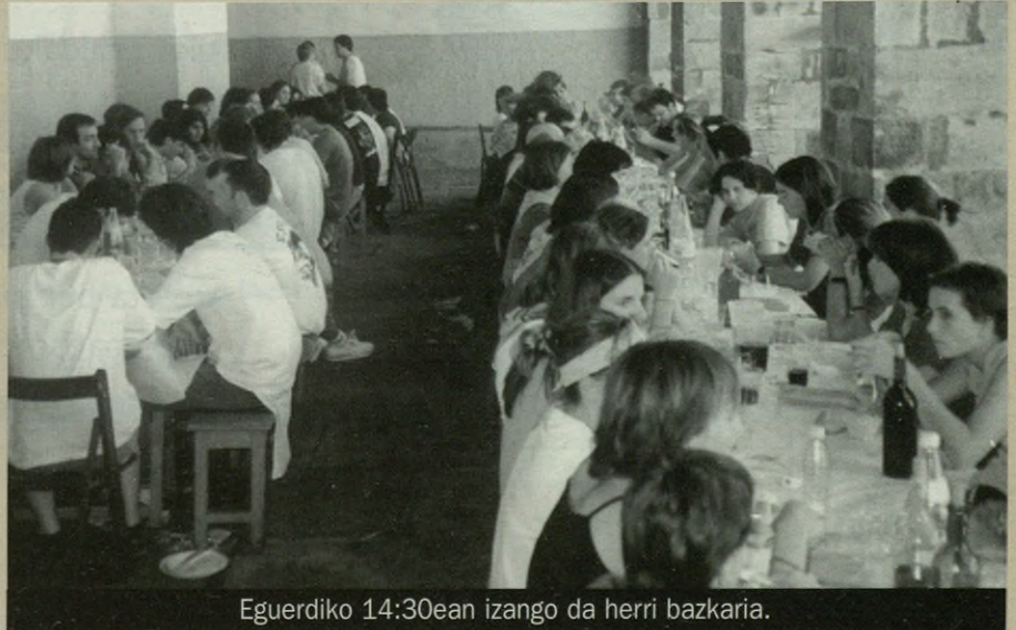
Eguerdiko 14:30ean izango da herri bazkaria.

Txartelak ohiko lekuetan egongo dira salgai: Larrea eta Surpe tabernetan, eta Gaztetxean.