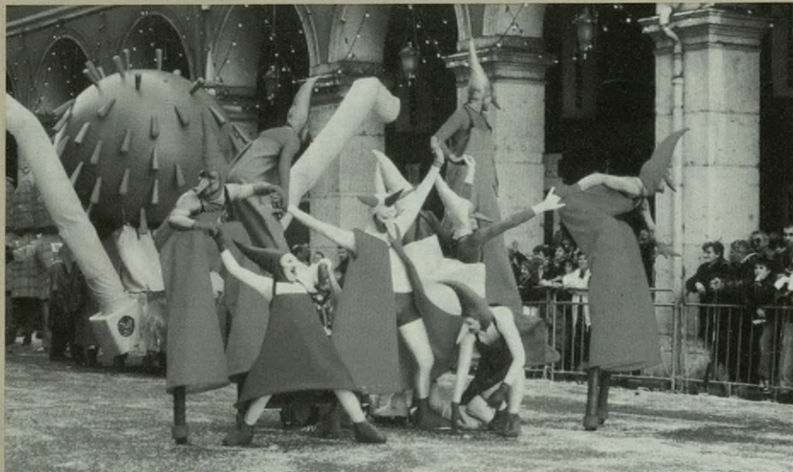
Herri bazkariaren ostean, Hortzmuga taldeak Rekolore antzezlan eskainiko du.

INCANSABLES txarangarekin JAIEN AMAIERA.