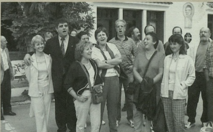
Urtero abesten du Antzuolako abesbatzak salbea, jaietako lehen egunean.

Nafarroako Xabier Deunaren himnoa eta Puy Amabirjinarena ere berak konposatu zituen; oso bereziak dira nafarrentzat, eta lizarratarrentzat, bereziki. Datorren egunean, beraz, Antzuolako konpositore handi honen salbea entzuteko aukera izango dugu.