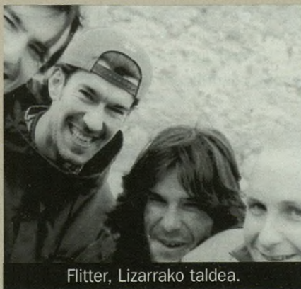
Flutter, Lizarrako taldea.

gogorragoa egiten hasi ziren; hardcore eta metaleruntz hurbiltzen hasi ziren. Orduan, Gasteizko Mil a gritos disko etxerekin topo egin zuten; disko etxe honek apustu handia egin zuen talde horrekin,