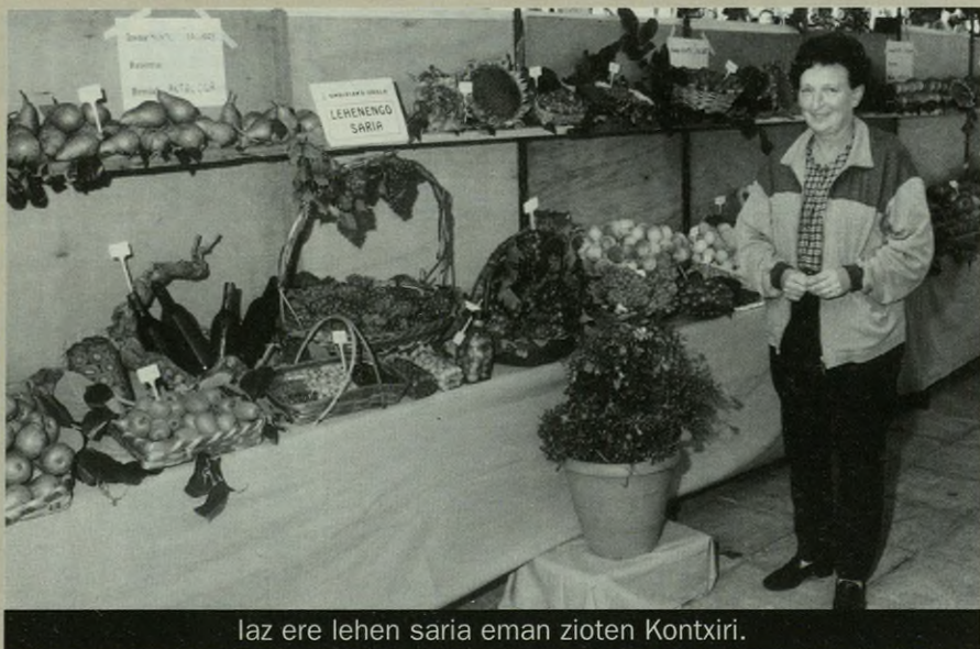
laz ere lehen saria eman zioten Kontxiri.