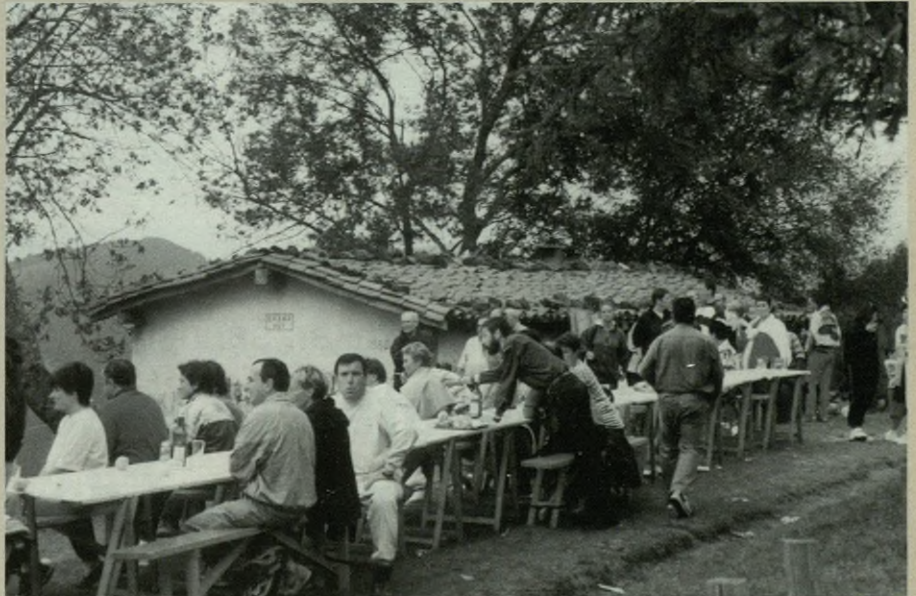
Bazkalostea herriko trikitilari gazteek alaituko dute.

1974ko irailaren 8an ospatu zuten Finalista Eguna lehendabiziko aldiz. Garai hartan, baina, Koroson izaten zen. Orduan ere mendizaleen jaieguna izaten zen Finalista Eguna. Baina, horretaz gain, sariak banatzen zituzten herriko mendizaleen artean. Urtean zehar igotako mendien arabera banatzen zituzten