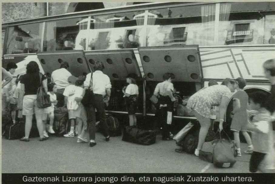
Gazteenak Lizarrara joango dira, eta nagusiak Zuatzako uhartera.

144 ume horietaz 17 irakasle arduratuko dira. Maila bakoitzak bere tutorea izango du, 10 tutore guztira. Bestalde, heziketa fisikoko irakasle bat eta ingeleza irakatsiko dien beste bat izango dute. Laguntzarako beste hiru irakasle ere izango dituzte herri ikastetxean. Hiru irakasle horiek hainbat gauzatzaz ardurtzen dira: txikienen sarrera prozesuaz,