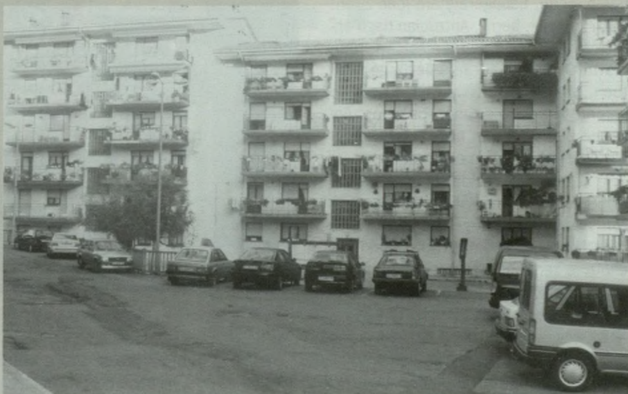
Balio katastrala berritzeaz gain, 2001etik aurrera, tipook berrituko dituzte.

OREKA BILATU NAHI IZAN DU UDALAK Diputazioak egindako berrikuspenarekin, ondasunen balioa asko hazi da, higiezinaren merkatua hartu duelako erreferentzia moduan; aurten ordaindu dutenaren bikoitza edo hirukoitza ordaindu beharko lukete herritarrek datorren urteko aurrera, Udalak tipook aldatu izan ez balitu. Igoera hori ekiditeko, diru kopuru jakina batzea erabaki dute, iaz kobratutakoari Kontsumo Prezioen Indizea gehi-