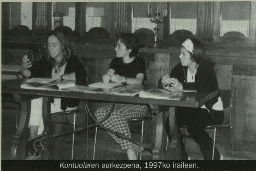
Kontuolaren aurkezpena, 1997ko irailean.

Kontuolaren zeregina ez da izango asteak eman dituen berriak ematea bakarrik; hori ere bai, jakina, baina Kontuola hori baino harantzago doa, eta albiste ez diren bestelako hainbat informazio eskainiko ditu: zerbitzu-informazioa, agenda, elkarrizketak, iritziak... Hortaz, asteak eman dizkigun gertakariez gain, era askotako informazioa zabaltzea izango da Kontuolaren zeregina. Gainera, kontuan hartu behar dugu Antzuola herri txikia dela, eta astekari baterako adina albiste ez dela gertatzen. Horregatik, eta astekari baten oinarri bakarra ez denez albisteen berri ematea, zerbitzu in-