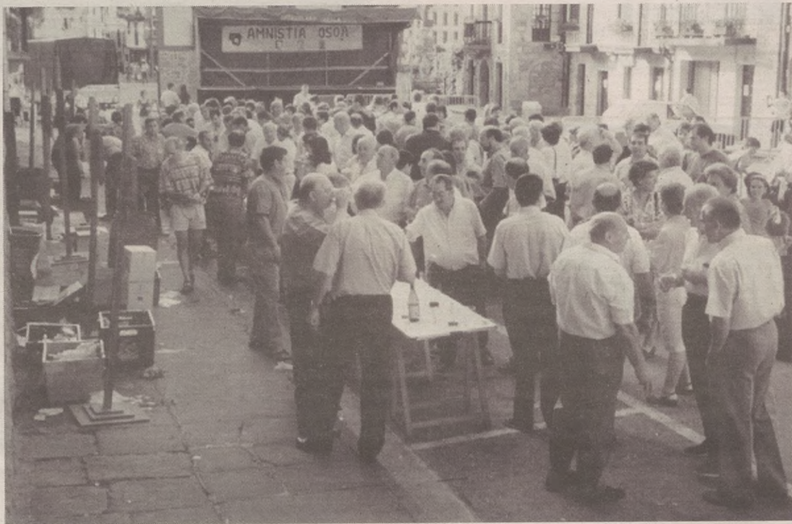
Herritarrek oso ondo erantzun zuten udaberriko festan, Anelkarreko kideen esanetan.

Hainbat ekitaldi egongo dira egun horretan. Alde batetik, jaialdi guztietan egin ohi duten moduan, bidezko merkataritzako produktuak salduko dituzte, Arra-