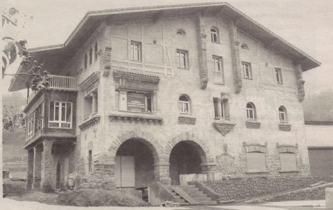
Behin Lantegi Eskolakoek euren lana bukatuta, azken ukituak besterik ez zaizkio faltako Olaran etxeari.

Horixe izango da Olaran etxea hilabete gutxi barru. Mankomunitateak enpresa ekimenean zentro bat kudeatzen du orain dela lau bat urtetik. Euren helburua, enpresa berriei edo sortzera doazenei, nolabait, laguntzea da. Horretarako, beharrezko dituzten lokalak ematen dizkie eta tasa baxuak kobratu. Zerbitzu enpresak edo enpresa industrialak izan daitezke Mankomunitatearen laguntza jasotzen duten enpre-