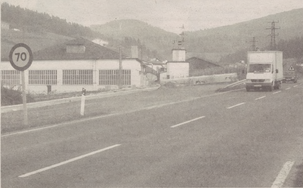
Sagasti auzotik egiten ari diren lotunea ere kontuan har dezala eskatu diote Diputaziolari.

Bestalde, eta aurrekoarekin lotuta, herriarekin lotuneetan hainbat hobekuntza egin beharra dagoela uste du Udalak, eta halaxe azaldu dio Diputaziolari. Batez ere, Lapatza pareko lotunea jotzen du arriskutsutzat Udalak, baina baita Goizper parekoa, Beheko auzokoa eta futbol zelairakoa ere. Sagasti auzotik egiten ari diren errepiderako lotunea ere