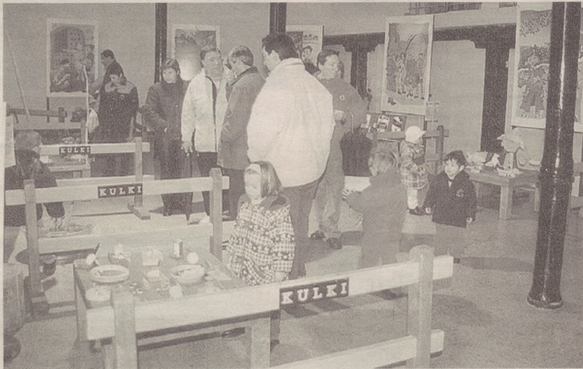
Hamar txokotan banatuta egongo da jolasen erakusketa, eta Kulkiko kideak hantxe izango dira azalpenak emateko.

Erakusketa ez da umeendako bakarrik, ezta gurasoei bakarrik zuzendutakoa ere. Denek dute zer ikusi eta zer ikasi erakusketan. Hala ere, Kulkiko kideen esanetan, "gurasoei zuzenduta dago bereziki". Izan ere, gurasoek indar handia dute umeengan, eta garrantzi handia dauka gurasoek umeekin jolas egiteak.