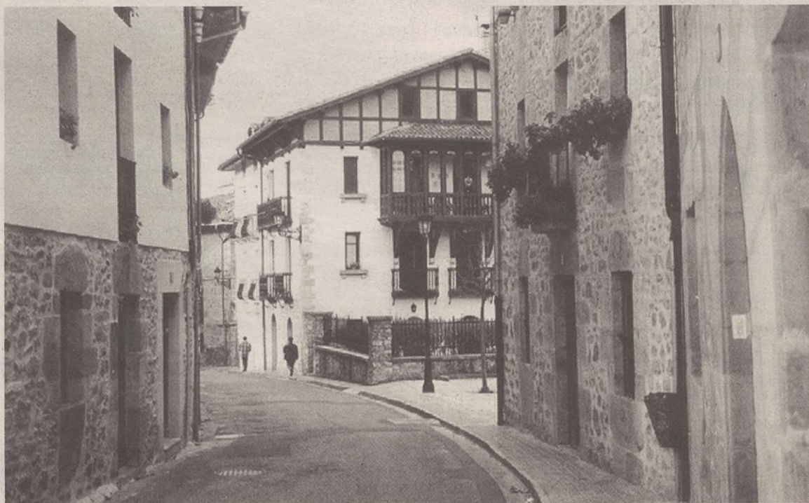
Alde zaharra mantendu, babestu eta birgaitzea izango da plan bereziaren helburua.

Arau subsidiarioen berrikuspenak ere aurrera jarraitzen du; ez dute oraindik behin betiko dokumentua onartu; arauak hainbat gune urbanistikotan banatzen dute herria, horien artean, hirigune historikoa dugu. Hirigune hori arautzeko, plan