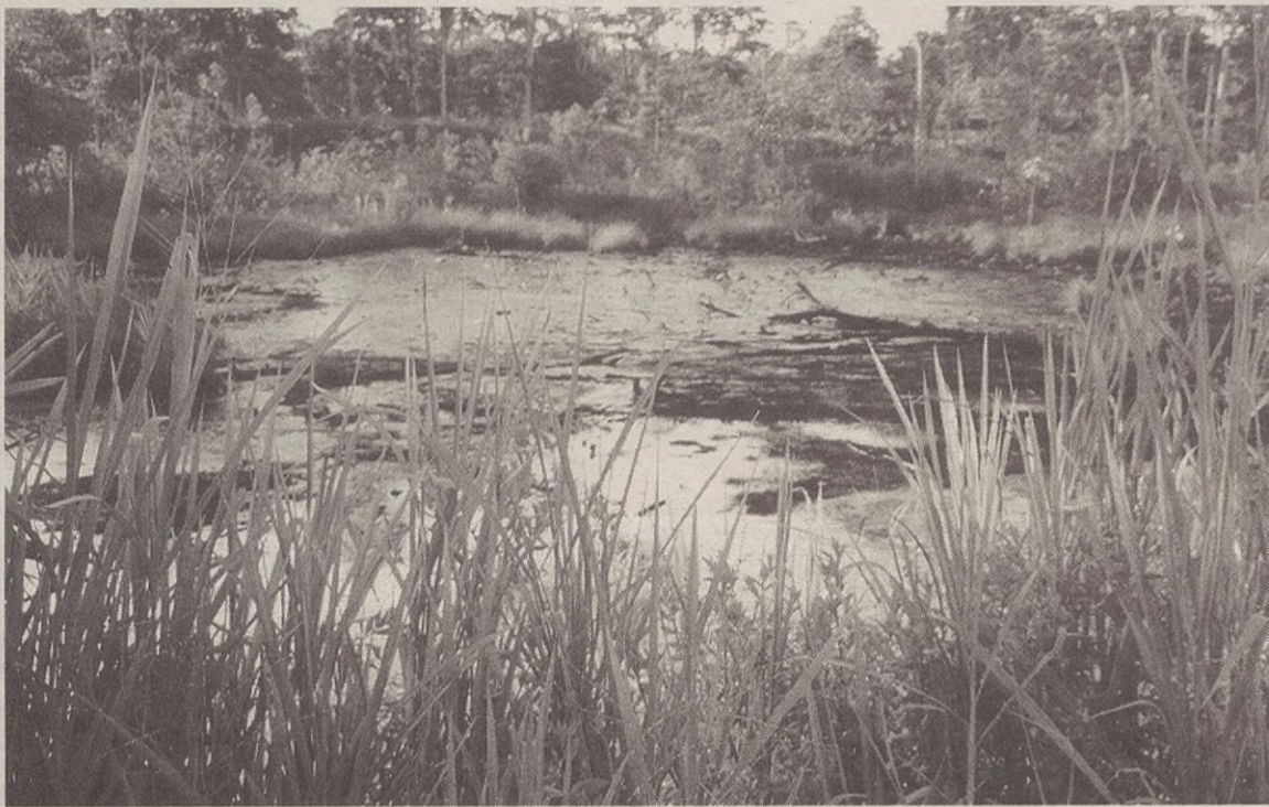
Ekuadorreko Amazoniako petrolio putzu bat.

1970eko hamarkadan petrolio putzuak aurkitu zituztenetik