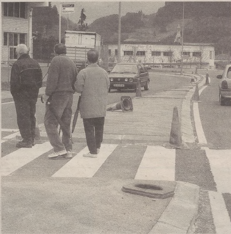
Oraingo astean bertan hasi dira oinezkoendako babesgunea egiten.

Orain egiten ari diren oinezkoendako babesgunea, baina, lehenengo urrats bat besterik ez da. Oraindik Diputazioak ez du errepidearen egoera hobetzeko behin betiko proiekturik egin. Horretan dihardu momentu honetan, proiektu zabalago bat egiten, hain zuzen ere. Diputazioko arduradunen esanetan, Aste Santu osterako prest egongo da proiektua. Errekaldeko