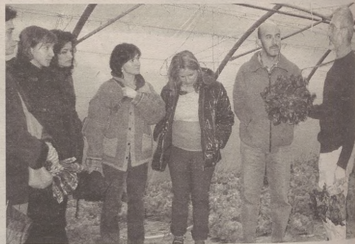
Eguaztenean izan zuten Lapatzakoek lehenbiziko bisitaldia.

Barnetegi txiki bat antolatu zuten euskara ikasten diharduten bilbotar ikasle horiek Antzuolan, Ibarre baserri turismoa. Bide batez, inguruak ikusteko aprobetxatu zuten, eta Antzuolako errota ikusten ere izan ziren.