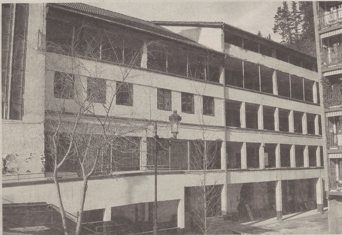
Gizarte Etxeko lanendako aurrez ikusi dute inbertsiorik nabarmenena.