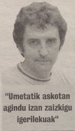
"Umetatik askotan agindu izan zaizkigu igerilekuak"

Cornago herria bera menditontor batean dago, gutxi gorabehera 760 metroko altueran. Herriak goialdean