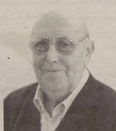
"Nagusiok ahalegina egin behar dugu gauzak egiteko"

gainean. Eskaera egin zuten gure, edo hobeto esanda, herriaren oniritzia jasotzeko eta sinadurak emateko; horrela, lehen aipaturiko bilera horretan ahalik eta bultzakadarik handiena egiteko moduan azaldu zitezten. Herriak ulertu zuen eta sinadura mordska bildu ziren; baina, esan beharra dago gutako askok, nagusien artean behar baino gehiagok, ez ziotela garrantziarik eman.