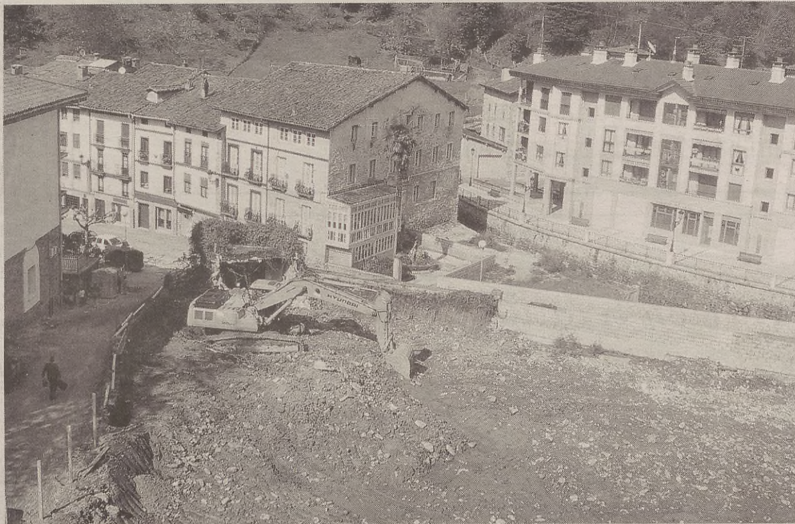
Orain dela pare bat aste hasi ziren eskabadorak lanean.

Ortuibar enpresak egingo ditu etxebizitzok. Horretarako, orain dela pare bat aste hasi ziren dagoeneko eskabadorak lanean, eta horrek kexa bat baino gehiago sortu du bizilagunen artean. Sagasti auzoko bizilagun batek KONTUOLA aldizkarira deitu zuen esanez etxe inguruak zikin-zikin eginda zeudela, lokaztuta, eta "ia etxetik irten ere ezin dugu egin", gaineratu zigun. Orain, baina, azken egunetan euririk egin ez