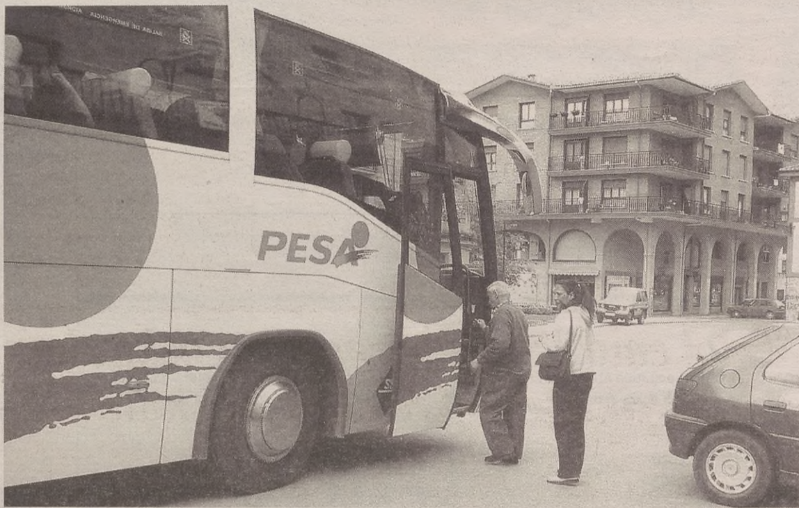
Begarako igerilekuetara joateko garraio bat ipintzea eskatu dute, Udal Zerbitzu moduan.

Sinadurak batzen ibili diren herritarretako batek zera adierazi digu: "Ez dugu urte osorako autobus zerbitzua eskatzen, badakigut eta gastu handia ekarriko lukeela. Guk eskatzen dugu udako hila-beteetan autobus gehiago jartzea, Antzuolako jende asko joaten delako Bergarako igerilekuetara". Gaur egun badaude Bergarara joateko hainbat autobus, baina ordutegia ez da batera ego-