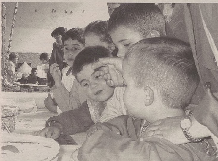
Umeak ere pozik ibili ziren, posturik postu.