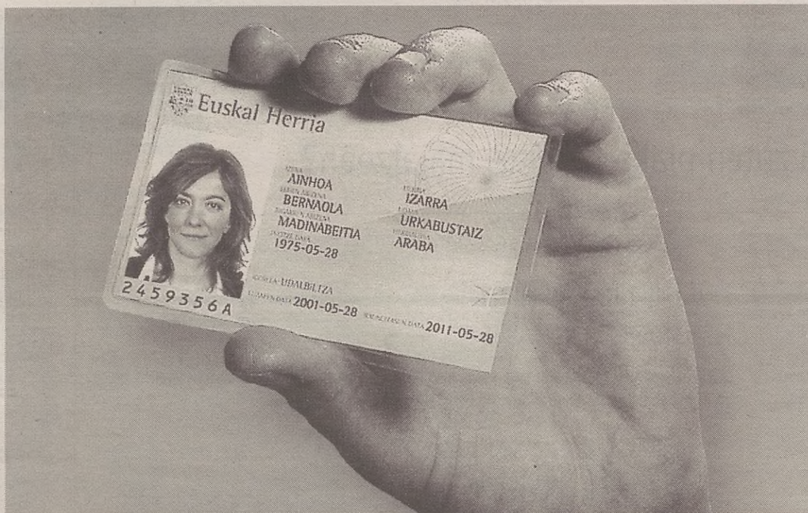
Naziotasun Aitormenarekin batera, argazkikoa bezalako txartela bidaliko dute Udalbiltzatik.

Nortasun-agiri neurriko hiru argazki eta errolda-agiria aurkeztu beharko dituzte udaletxean EHNA egin nahi dutenek. 12