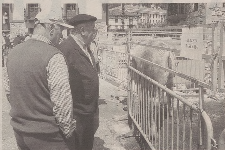
Azokan egon ziren ganadu guztiak Antzuolako baserrietakoak ziren.