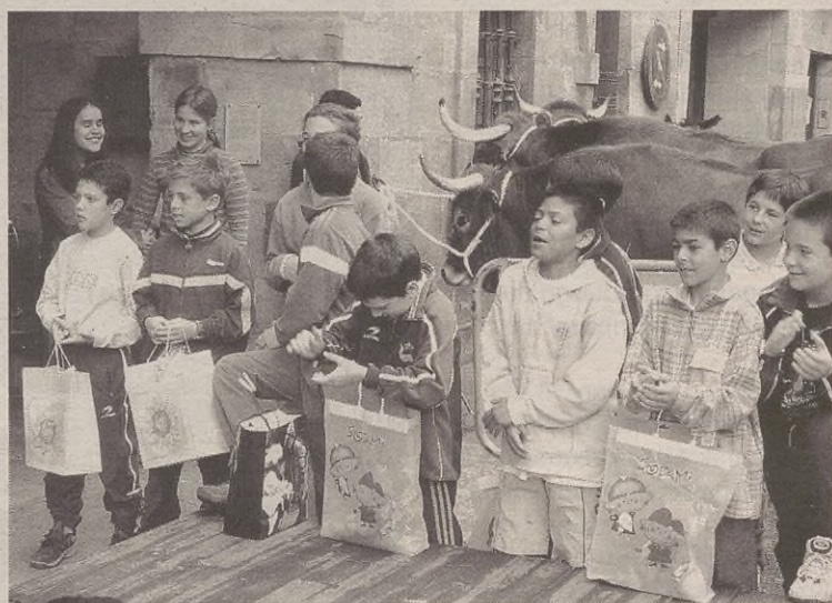
Zazpi sari banatu zituzten Patxiko Txerren ipuingintzan.