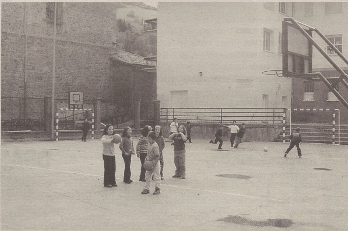
Entrenamendu saio gehientsuenak eskolako jolaslekuan egiten dituzte.

Antzuolako Udalean duela gutxira arte kirol teknikaririk egon ez denez, eskola kiroleko antolaketaren zati handi bat herri ikastetxeak hartu izan du bere