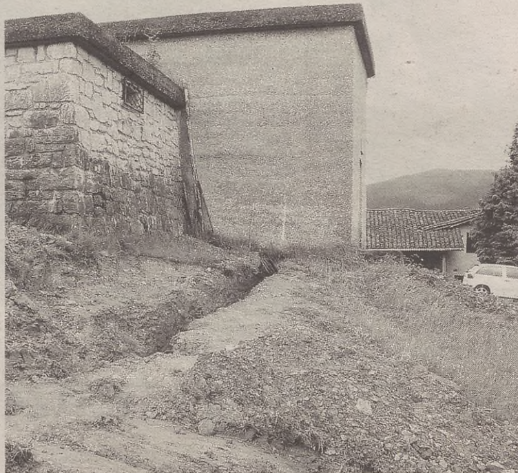
Aitzagako depositoaren inguruan hodiak sartzten ari dira.

Bergararainoko azpiegitura eginda dago; hortaz, Bergararik Antzuolara bitartekoa egingo dute orain. Herrian Bide Zaharra bezala ezagutzen den bidetik ari dira hodiak pasatzen. Gero, Aristi bi baserrien tartetik pasatuko da sarea; handik, erreka eskuineko aldetik, Lizarragako hiri-bideraino eta handik Aitzagara.