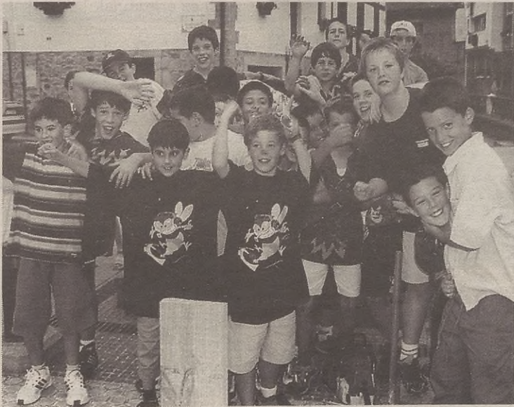
Auzoko jaiak izanik, umore onez zebilen jendea, baita gaztetxoak ere.