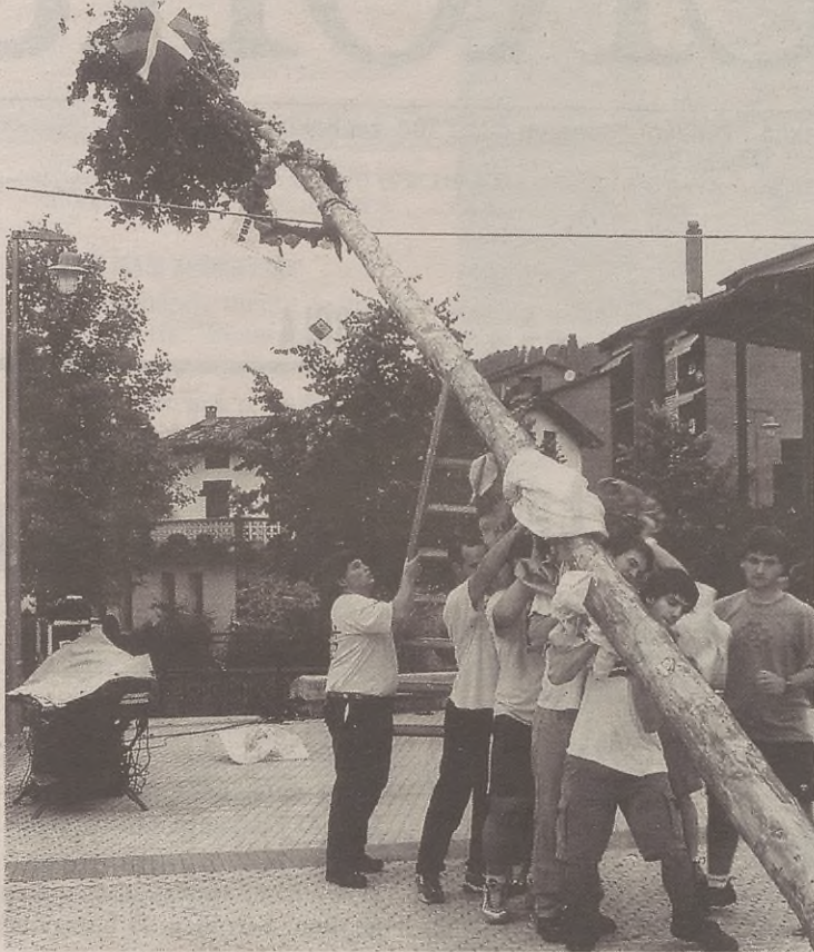
Auzoko mutilek ez zuten lan handirik izan makala jasotzen.

Iluntzean, berriz, San Juanetako ohiturari jarraituz, makala jaso zuten herriko plazan, 20:00etatik aurrera. Behin makala ondo jarrita, Oinarin taldeko dantzarien saioa izan genuen makalaren inguruan.