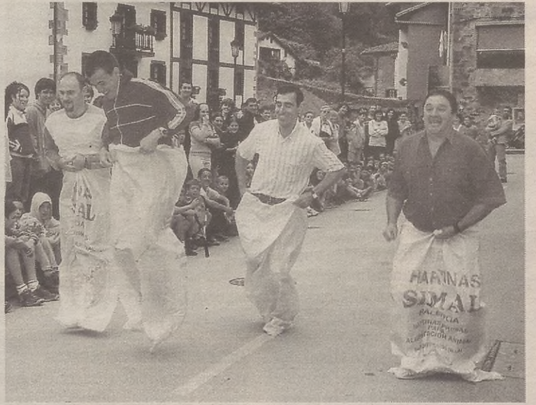
Asto Lasterketarik ez, baina bestelako jokoak ez ziren falta izan domekan.