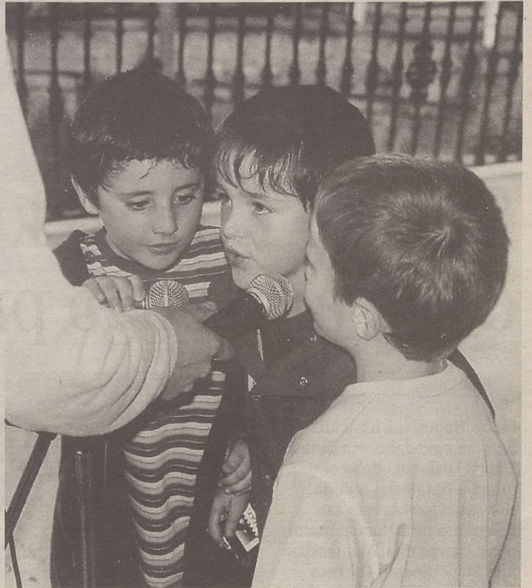
Boladan dauden kantuak abesteko aukera izan zuten Karaokean gaztetxoek.