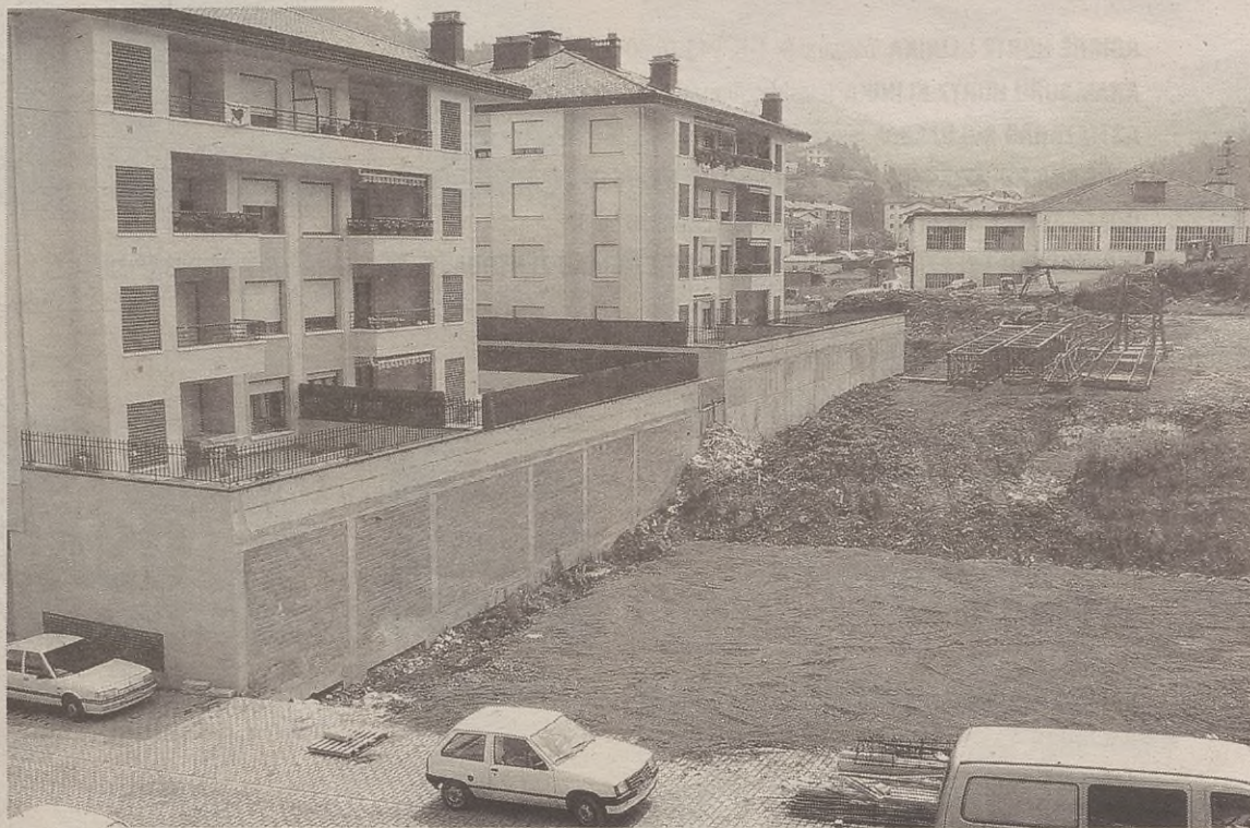
Laster hasiko da Antzuola Udala Etxegintza hirugarren etxebizitza multzoa eraikitzen.

Herriko jaien ostean, informazio zabaldua eskainiko dute Udaleko arduradunek, etxez etxe banatu-