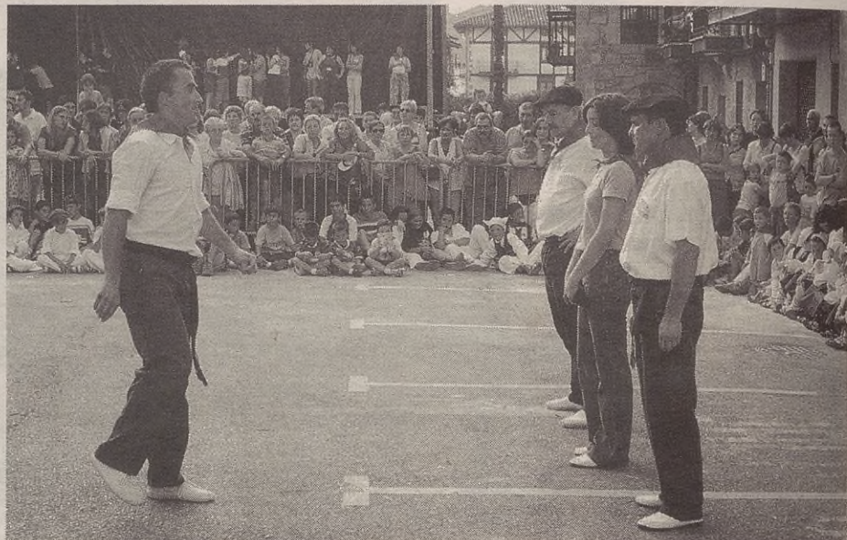
Zinegotzien eta dantzarien dantza saioarekin hasi ziren jaiak.