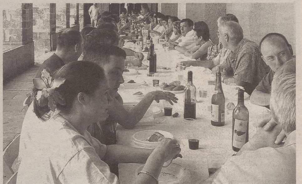
Urteroko ohiturari jarraituz, jendeak ez zion hutsik egin domekako herri bazkariari.