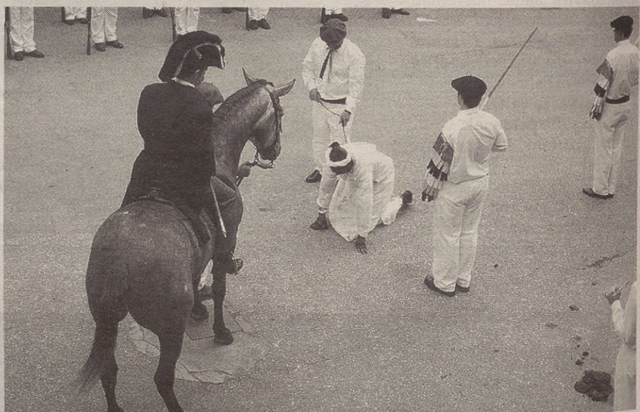
Eguraldiak ere lagundu zuen, eta iaz baino jende gehiago batu zen Mairuaren Alardea ikusteko.

DEKORAZIOA ABAD PINTURAK ANTZUOLA PAPER PINTATUAK