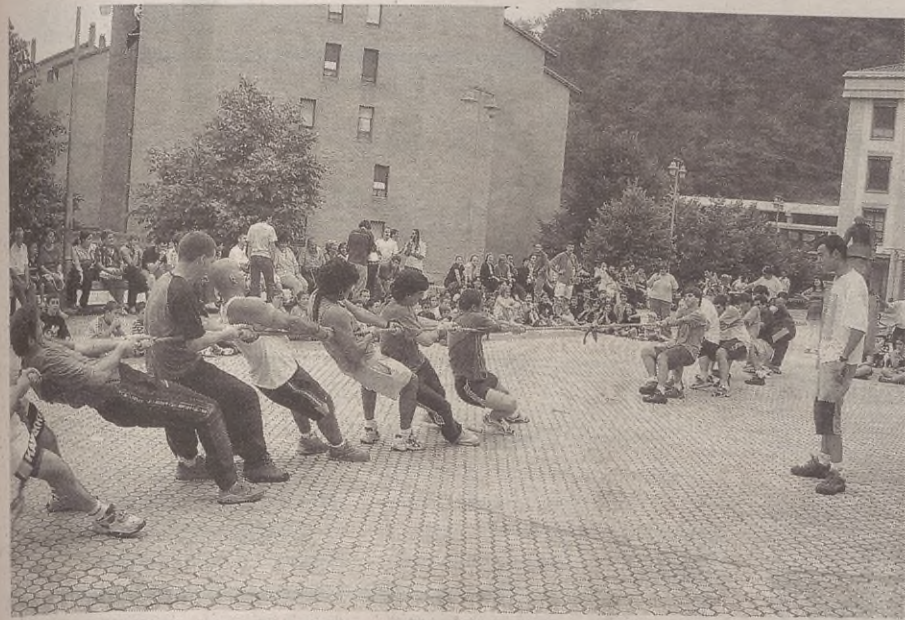
ETXARRIARRAK NAGUSI Aiherrako, Osintxuko, Etxarri-Aranazko eta Antzuolako taldeak aritu ziren norgehiagoka zapatu arratsaldean. Arrakasta itzela izan zuen Gazte Asanbladak antolatutako Herri Kirol Txapelketak, eta giro ona izan zen nagusi; Zurragi lepo bete zen. Azkenean, etxarriarrak nagusitu ziren; osintxuarrak eta antzuolarrak bigarren geratu ziren, puntu bereberekin, eta Aiherrakoak azkeneko tokian.