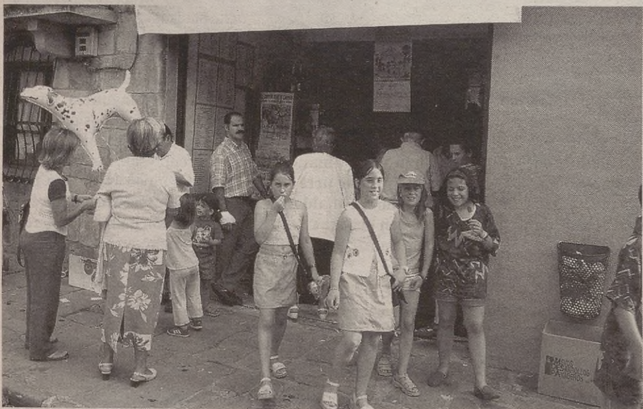
Izugarritzko arrakasta izan zuen Anelkarren tonbolak, eta sari guztiak banatu zituzten.