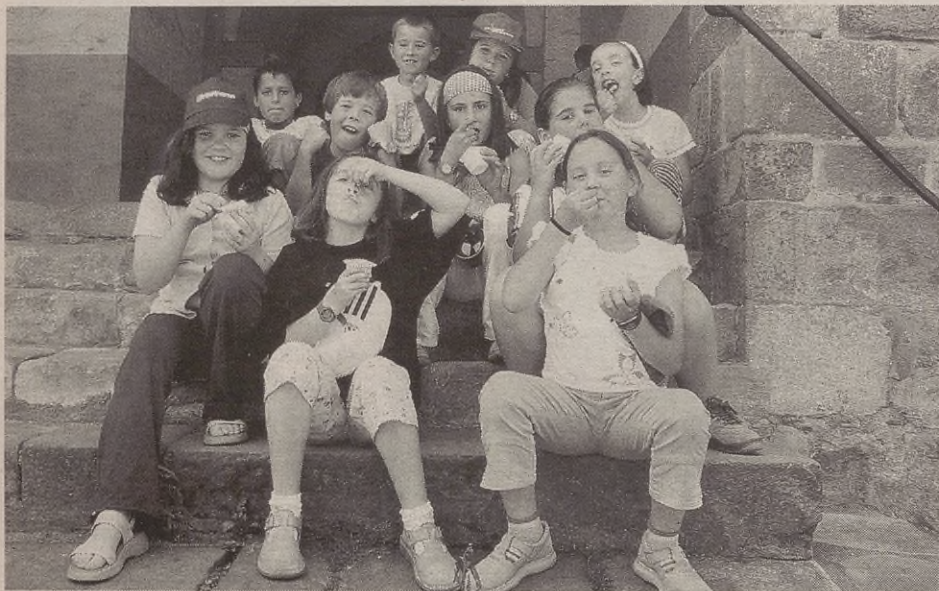
Gerizpe bila ibili ziren egueneko herri bazkarian parte hartu zuten neska-mutikoak.