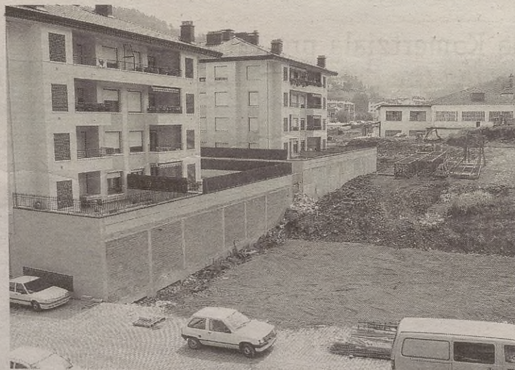
Irailaren, egubakoitzero, aholkularitza zerbitzua eskainiko du Suradesak.

hamasei etxebizitzetako bat erosi nahi dutenei. Udaletxean bertan egokituko dute horretarako bulegoa, eta beharrezko informazio guztia eskainiko diete interesa duten guztiei. Irail osoan, egubakoitzero egongo dira Suradesakoak, 08:00etatik 14:00etara. Zerbitzu hori erabili nahi dutenek alde aurretik txanda eskatu beharko dute, udaletxeko telefono zenbaki honetara deituta: 943 76 62 46.