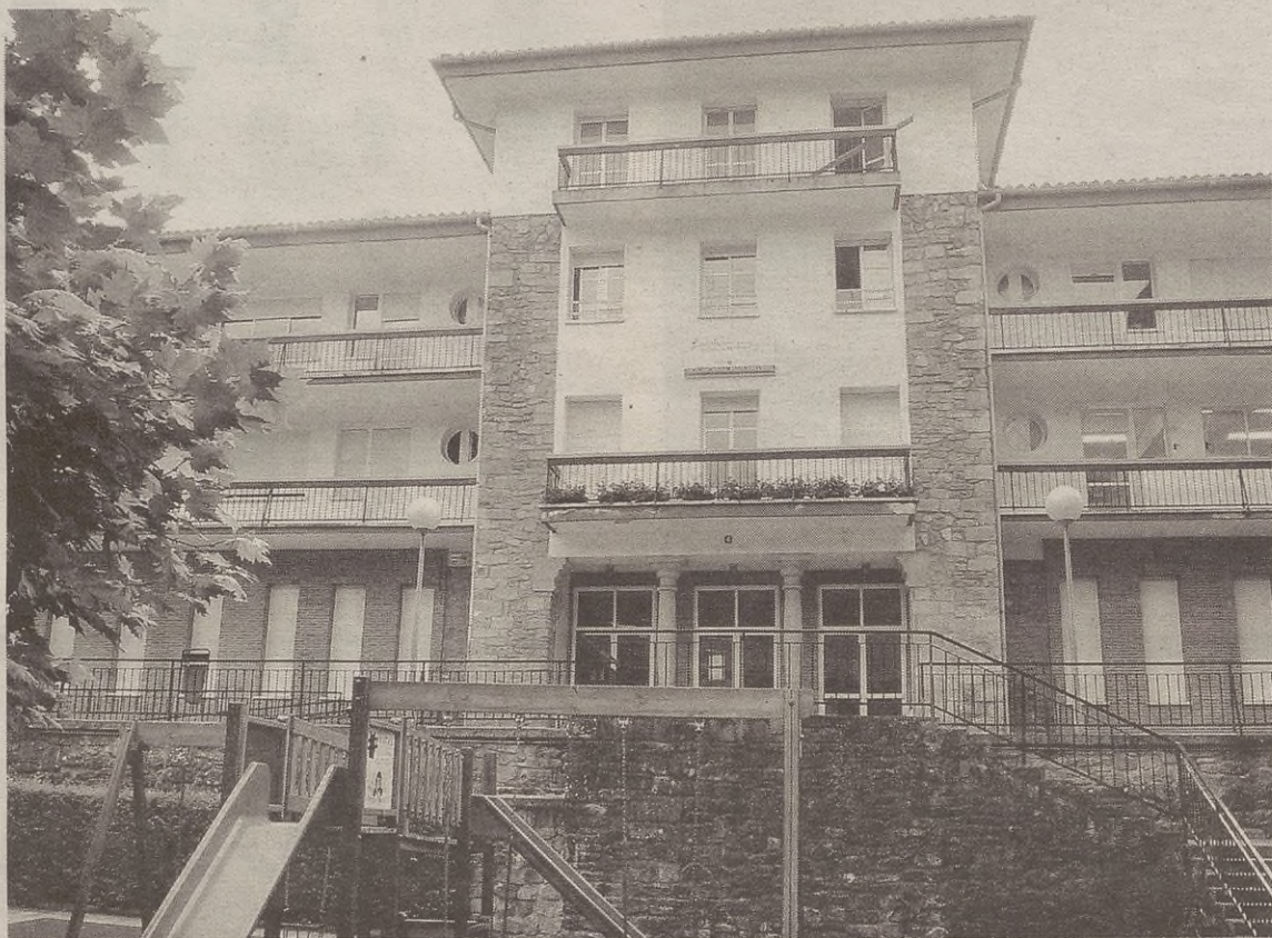
Hogeita lau ume eman dute izena jantokian bazkaltzeko.

Esan bezala, 24 ume hasiko dira, oraingoz, jantokian bazkaltzen, baina 40 bat umerendako tokia dago. Hortaz, aurrera begira ume gehiagok ere badaukate izena emateko aukera.