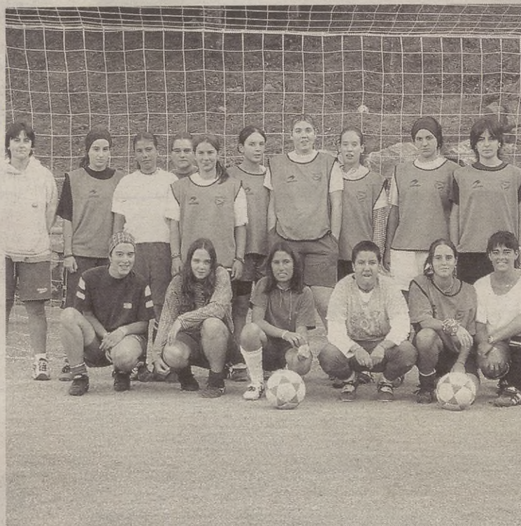
Aurten ez dugu nesken talderik izango, ezta kadeteen talderik ere.