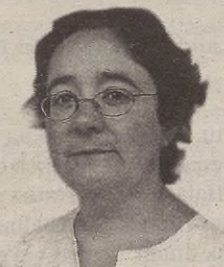
“A ze ‘engorroa’ den anbulatorio horretara deitzea!”

Baina hori ere oroimenean geratu zaigu, eta gaur zertaz idatzi? Ama bezala, seme-alaben heziketan aurkitzen ditugun zailtasunei buruz? Liburu-saltzaile eta irakurle bezala ikusten ditudanak,...? Ez, horiek beste batera-