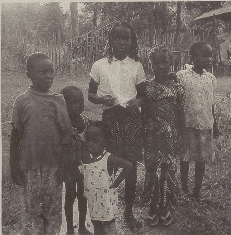
Oussouye herriko neska-mutiko talde bat.

Biharko Elkartasun Festan Giokela elkarteak emandako eta eurek prestatutako saiheskia jate-