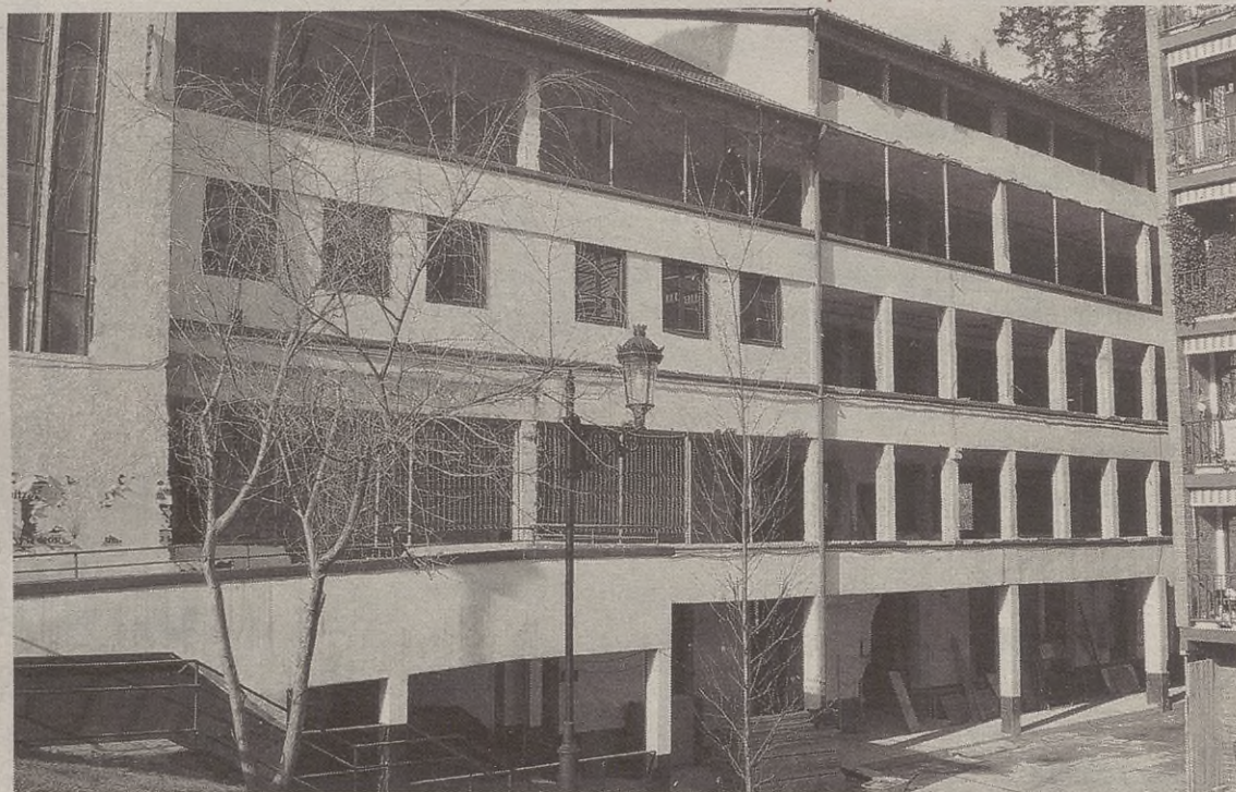
Azkeneko hamar hilabeteotan geldi egon dira eraikineko lanak.

Udalarendako, eraikina ez botatzea garrantzitsua zen, eraikinak baduelako historia.