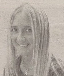
"Lotsagarrixa da Gabonei emuten jakuen zentzua"

Hori izengo da orduan hainbeste entzuten dan "espíritu navideño" dalakua. Egixa da Gabonetako epokiak bere gauza onak be badauzkala, ez dogu esango dana negatibua danik. Baina nere ustez benetan lotsagarrixa da Gabonei gaur