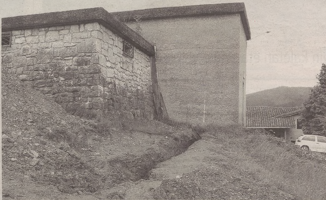
Maiatzean hasi zituzten Urkulutik ura ekartzeko lanak.

Erremate txiki batzuk besterik ez dira falta lanekin amaitzeko, baina oraingo astetik bertatik aurrera, Urkuluko ura izango dugu Antzularako etxe guztietan.