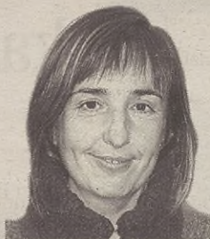
"Txalo bero bat borondatez lanean ari zareten guztioi!"

Baina bueno; harira bueltatuz, hauetariko talde bat aipatu nahi nuke: dantza taldea. Egia da talde honetan daudenak gustuko dutela dantza egitea. Baina hau ez da beraien eginkizun bakarra. Besteak beste, beste batzuei erakusteko ardura ere badute, haur zein nagusi. Haurrekin urte osoan