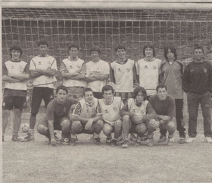
Gazteen futbol taldeak Behobiaren aurka jokatu du zapatuan, Estalan.

Bergarako eta Antzuolako taldeek puntu berak dituzte. Antzuol-