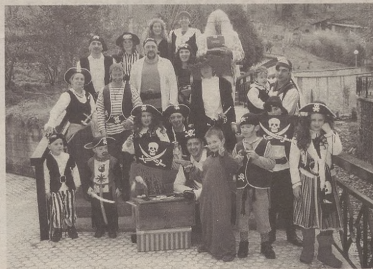
Domekan, piratek hartu zuten herria.

Domekan, berriz, ohiturari jarraituz, Inauterietako dantzen txanda izan zen. 10:00etatik ibili ziren dantzariak kalejiran. Egurdian, berriz, ikuskizun polita eskaini zuten dantzariak plazan.