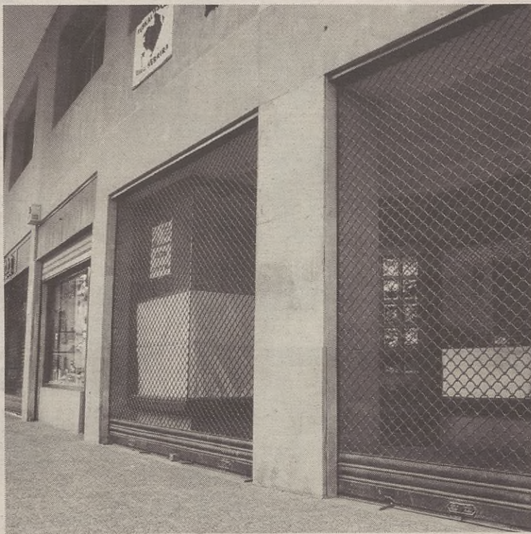
Baliteke oinetako denda egon zen lokalean jartzea gaztetxe berria.

Udaleko ordezkariak aukera biak aztertzen jardun dute, eta egueneko osoko bilkuran horietako baten aldeko erabakia hartzeak ziren.