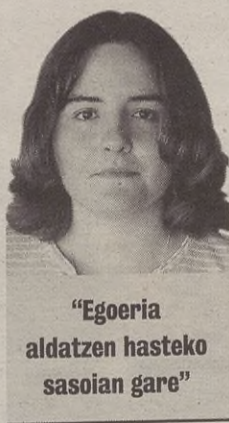
“Egoeria aldatzen hasteko sasoian gare”

eztakitt zeatik baina uste dot udaberri hau be ez dala ezberdina izango. Otsaila motza da, baina notiziaz lepo egon zan, hiru egunian 30 atxilotu, euskaraz egiten zan egunkari bakararra itxi zeben, eta berriz agertu zien tortura salaketak; berriz esaten dot, ez deigun ahaztu urtiak diela atxilotuak torturak salatu dituztela, etengabe. Gerra hotsak, eta espainiar betiko