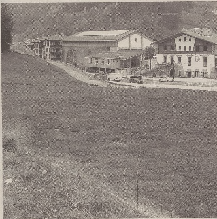
Udalaren asmoa da igerilekuak Sagasti auzoko zelaian egitea.

ZMZ enpresari esleitu zizkionten aurre proiektua egiteko lanak. Gauzak horrela, bazirudien aurrera zihoala orain arte asmo hutsa zen proiektua. Baina, aurreko astean bertan, Diputazioaren jakinarazpen bat jaso zuen Udalak, Sagasti auzoan igerilekurik ezin dela egin esanaz. Badirudi arrazoiak dela inguru horretako lurzorua ez dela egonkorra; Udala, baina, ez dago konforme Diputazioaren jarrerarekin.