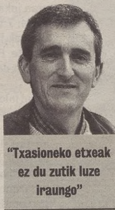
“Txasioneako etxeak ez du zutik luze iraungo”

Berehala konturatu nintzen jugadaz; egin zutena itxura