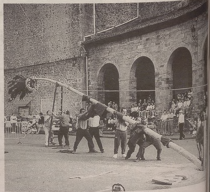
Astehenean, San Juan bezperan, jasoko dute arbola Herriko Plazan.

San Juan bezperan, berriz, ekainaren 23an, herrian bertan ospatuko dute jaiak. Iluntzean, 20:30ean, hain justu, arbola jasoko dute Herriko Plazan, eta gero, Oinarin taldeko dantzarien saioa izango dugu. Gero, balkoi eta leihotako lore lehiaketako sariak banatuko dituzte.