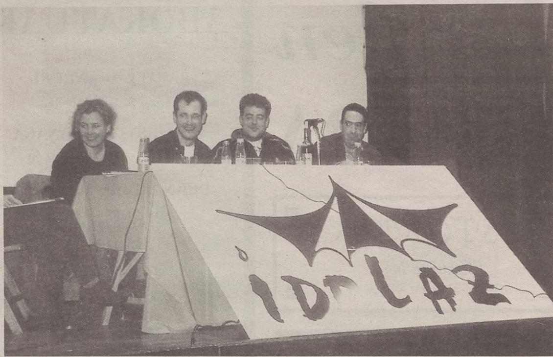
Lehenengo urteetan, batez ere, hainbat ekitaldi antolatu zituen Idolaz-ek.

Hortaz, zirt edo zart egiteko garaia zela ikusi zuten eta elkarrearen etorkizuna erabakitzeko