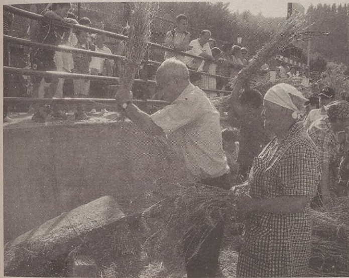
Gari-jotzea eskuz eta makinaz egin zuten antolatzaileek.

Domekan, berriz, erretiratuen eguna izan zen; 11:30ean meza entzun zuten eta eguerdian bazkaria egin zuten Udal Pilotalekuan. Jende askok parte hartu zuen eta giro ezin hobea izan zuten.