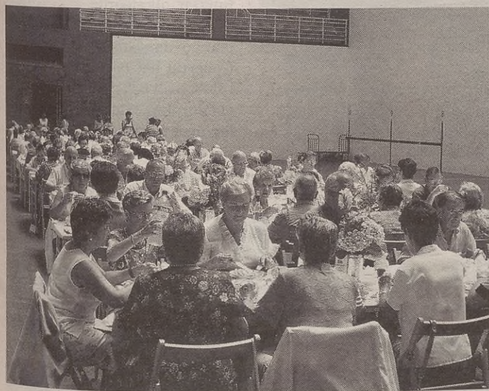
Jende ugari hartu zuen parte erretiratuen bazkarian.