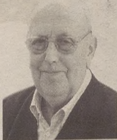
“Kirol hizkuntzan esaten den moduan, testigua pasatzera noa”

Orain, Erretiratuen Elkarteak Batzordea berritu egin da eta oso atsegin zait aldaketa horrekin batzordeak udaletxearekin izan behar dituen harremanak bide onetik doazela jakitea. Egoitza zaharra kendu dute, beraz, berria hurbiltzen doala esan daiteke. Baita aspalditik ditugun beharrak ere. Eguneko zentroa eta etxebizitza babestuak sortzeko bideari eutsi behar diogu eta hori bultzatu behar