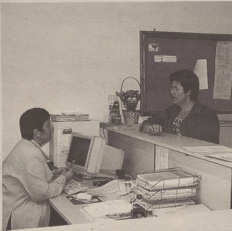
Udalak euskaraz funtziona dezan plan bat egingo du UEMAK.

Lehenengo urratsa izango da Udalarendako berarendako plana egitea; izan ere, eta kontuan hartuta UEMA udalez osatutako mankomunitatea dela, Udalak herritarrendako eredu izan behar du. Udal barruko funtzionamendua euskaraz izango dela bermatzeko egingo dute plan hori, Udaleko langile eta politikari guztiak kontuan hartuta. Eta dagoeneko egin dute plan horren bidegarritasun txostena.