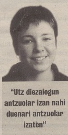
“Utz diezaiogun antzuolar izan nahi duenari antzuolar izaten”

tzen ez dugun jendearekin egiten dugu topo okindegian edo harategian. Era guztietako komentarioak entzun ditut honen inguruan: bizilagun berriak ez direla integratzen herrian; lo egitera bakarrik etortzen direla; etxe gehiago egin beharoko lituzketela herrikoentzat eta ez kanpokoentzat... Komentario batzuk asmo txarrik gabekoak badira ere,