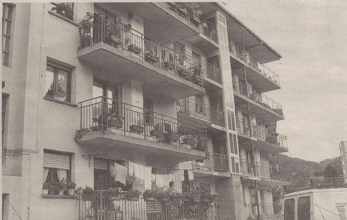
Errekalde auzoko bost etxebizitzatan jarri dute igogailua azkeneko bi urteotan.

Dirulaguntzak lortzeko eta igogailuak jarri ahal izateko ez da baldintza askorik bete behar;