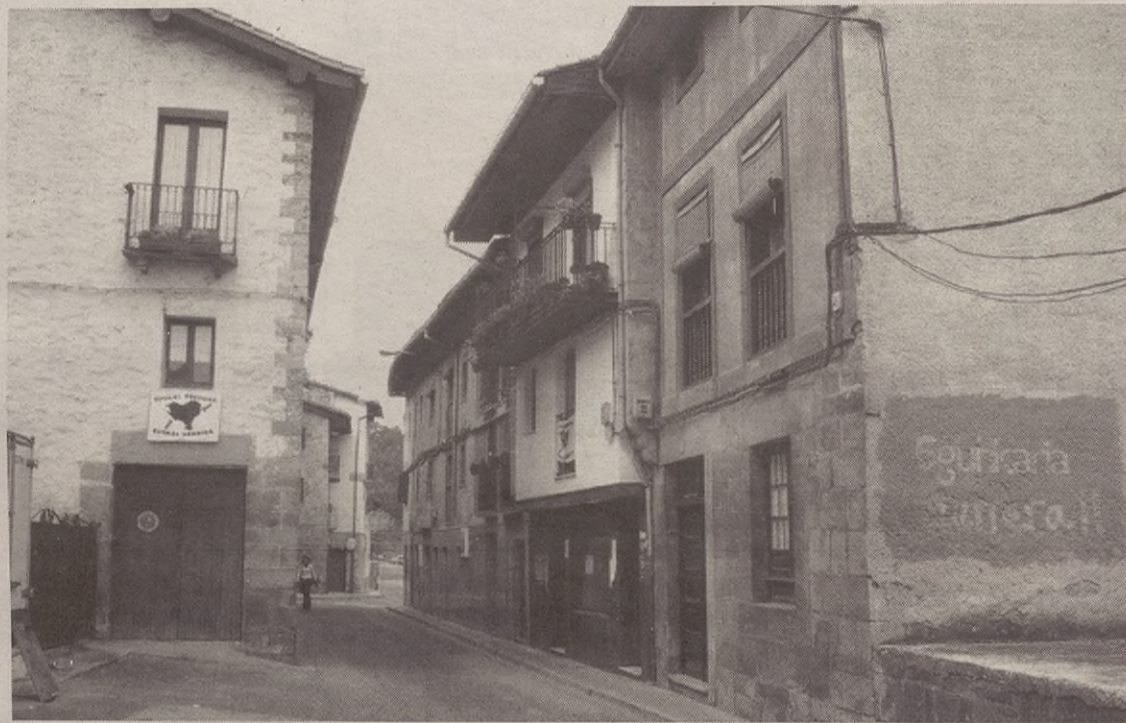
Plan berezi horren helburua da hirigune historikoa babestea eta zaintzea.

Hirigune Historikoa Birgaitzeko Plan Bereziaren helburua da herriaren gune hori babestea eta zaintzea, baina, era berean, baita bertako bizilagunen bizi kalitatea eta eraikinen kalitatea bera hobetzea ere.